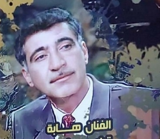
الفنان هابة ترك بصمات واضحة في المقامات والقوريات