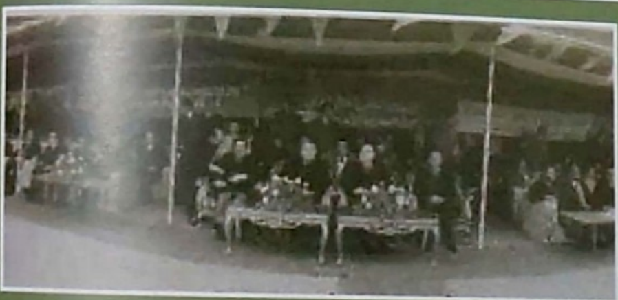
ئاھەنگی کردنەووەی ھێڵی عێراق - تورکیا ساڵی ١٩٧٧

بەرمیل لەرۆژێکدا . لەبەری عێراقی ھێڵەکە سن وویستگەیی پالنان (محطة الضخ) ھەبە لەبەری تورکیاش سن وویستگەیی پالنانی سەرەکی ھەبە ps3 (جەزیرە) ps4 ، (ماردین) ps5 (غازی عەنتاب) دوچار دەکات بەندەری (جەبھان) ی تورکی لەناوچەیی (ئەدەنە) سالانی ھەشتاکانی سەدەیی رابردوو سەردەمی زێڕینی ئەم ھێڵەبوو لە توانیدا بوو ١٦٠٠٠٠٠٠ بەرمیل لە رۆژێکدا ھەناردە بکات ، بەلام لە رۆژگاری ئەمڕۆدا ھەناردەکردن لە ١٠٠ ھزار بەرمیل رۆژانە تێناپەرت . بێگومان عێراق بەرامبەر ھەر بەرمیلێک نەوتی ھەناردەکراو بێرک پارە باجی بە تورکیا دەدا ، لە سەرما دا رێککەوتن بە (٤٢) سەنت بەرامبەر ھەر بەرمیلێک ئەگەر بێر ھەناردەکردن لە سەرۆوی (١،٥) ملیۆن بەرمیل بێت ، (٧٥) سەنت ئەگەر بێر ھەناردەکردن لە خوار (٧٥٠) ھزار بەرمیلەووە بێت . لەدوای ساڵی ٢٠٠٢ ئەم رێککەوتنە دەستکاری کراو بەم چەشنەیی لێھات :- (٧٠) سەنت ئەگەر بێر ھەناردەکراو لە ٤٠٠ ھزار بەرمیل زیاتر بێت ، (١١٢) سەنت ئەگەر بێرکە لە ٢٠٠ ھزار کەمتر بێت .