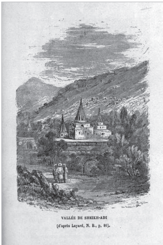
VALLÉE DE SHEIKH-ADI (d'après Layard, N. B., p. 80).