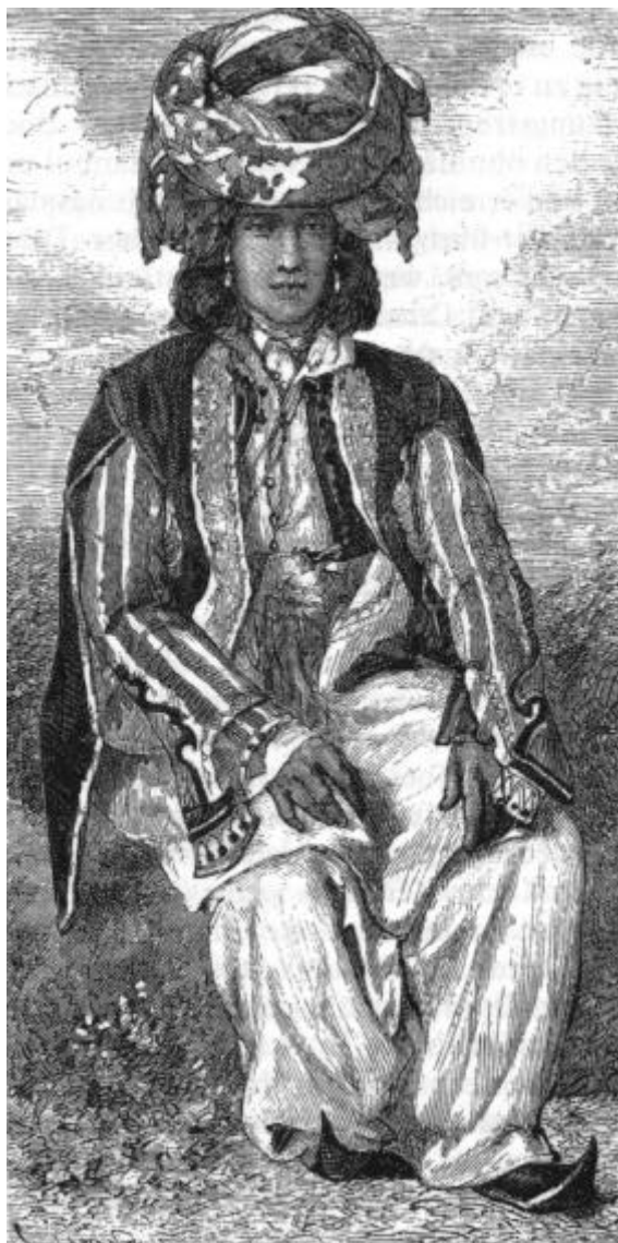
Kurdischer Agha (um 1870)