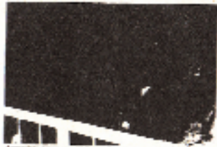
Arrestations dans les prisons de Turquie. Ici, les détenus de la prison centrale de Diyarbakir attendent d'être interrogés. Ce cadre de prison est un exemple de la situation.

Le nombre de prisonniers kurdes dans les prisons de Turquie, en Turquie, après les arrestations effectuées dans le cadre de l'opération de Diyarbakir, est estimé à 1000 personnes.