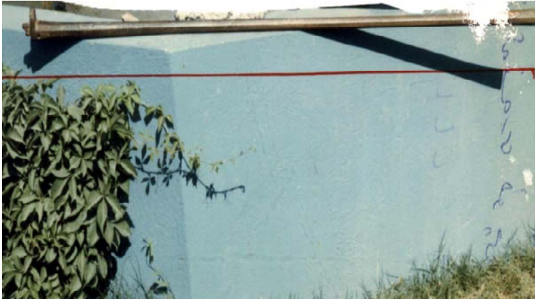
لووله‌ی تفهنگی شینکه

لووله‌که ههشتی‌یه، واته ههشت سووچه‌و، ههشت خانی ههن و خانه‌کانی پاسته‌و پاستن نهک، پیچ پیچ. له‌سه‌ر پشتی و نیژیکی کوتایی‌یه‌که‌ی، نه‌خشی سئ گول یا گول‌دانیک و دووگول هه‌گول‌دراوه. درییژی لووله‌که (۱،۱۳ مه‌تره) و، ئەستووری نیو پاستی (۷سم) و ئەستووری لای دەمی (۹،۵) و ئەستووری بنه‌که‌ی - واته لای کونی تیزه‌که‌ی - (۱۲سم) و عه‌یاره‌که‌ی - واته تیره‌ی کونی ده‌مه‌که‌ی - (۱،۵سم) ه. تیره‌ی (کونی تین) که له‌ته‌نیشته بنه‌که‌یه‌تی، (۶ ملم) ه. ئەستووری ئاسنه‌که‌ی دەمی (۵ ملم) ه، و، پی‌ده‌چی له ناوه‌راستیدا ته‌نکتر بی. پاش کونی تیزه‌که (۱سم) له لووله‌ بنه‌ره‌ته‌که ده‌می‌تته‌وه که کون نی‌یه. نیشانه‌که (۲،۵سم) به‌رزه‌و، به‌بنیه‌وه‌یه‌تی و، له