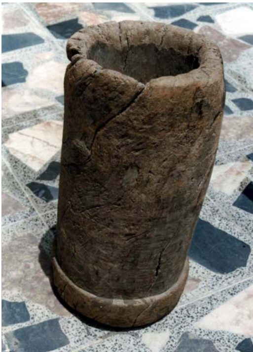
دۆلی بارووت کوتانی حاجی سه‌برییه

(۵۷سم) و دوراندهوری (۸۸سم) هو (۲۶ سم) قوولئه و تیره‌ی ده‌می (۲۲ سم). ئه‌ستووری جیی کوتانی تیدا. واته قه‌راغه‌کانی، (۴-۵سم)ه. ئه‌مه‌ش وینه‌ی دۆله‌که‌یه: