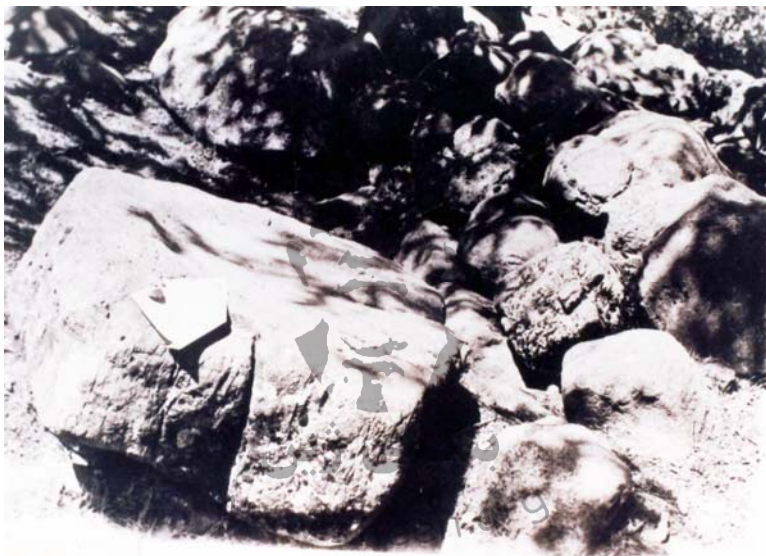
كووله‌كه‌ی بارووت (كولندكى بارووتی)

به‌ردى بارووت ه‌ارين قوول ئاكریته، به‌لكو كه‌ميك به‌لاری قوول ده‌كریته، وه‌ك له‌پى ده‌ستی مرؤف. بارووت ده‌خريته‌ سه‌ر ئه‌و به‌رده‌و به‌ به‌ردىكى ديكه‌ی لووس وه‌ك له‌پيشدا باسمان كرد ده‌ه‌اردیته. سه‌ره‌تا ده‌بى ه‌ه‌ریه‌كه‌ له‌ شوپه‌و گوگرد و خه‌لووز به‌ته‌نیا و تۆزىك به‌ ته‌پى به‌ه‌اردیته، ئه‌مجا به‌ تيكه‌لى. بى‌گومان هاوه‌ن و ده‌سكه‌وانیش به‌كه‌لكى بارووت كوتان دیت، به‌لام به‌رده‌كه‌ باشته‌ر، چونكه‌ مه‌ترسى گرتى به‌ربوونى به‌هوى ه‌ارینه‌وه‌ كه‌مه‌تره.