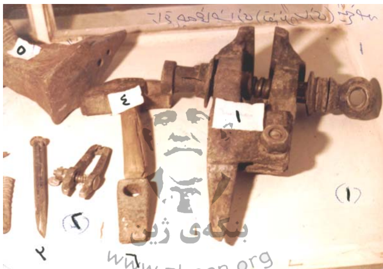
تاقمی چه‌خماخسازیی شیخ حه‌سه‌ن ۱. گیره‌ی گه‌وره‌ی ناو جه‌ر ۲. گیره‌ی بچوکه