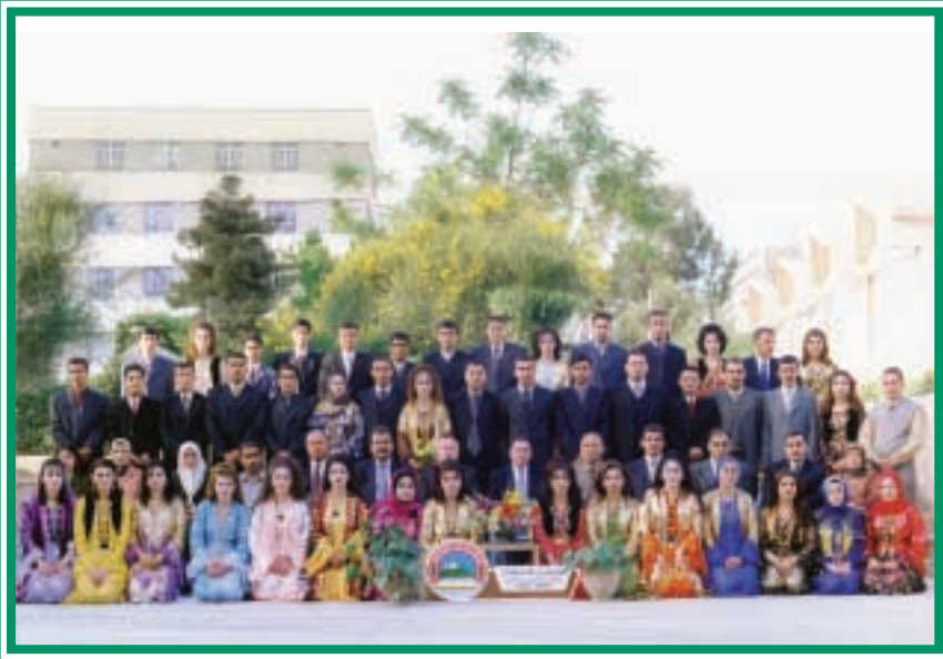
دەرچوانی کۆلیجی کشتوکاڤ / بهرربوومی ئاژهڤ