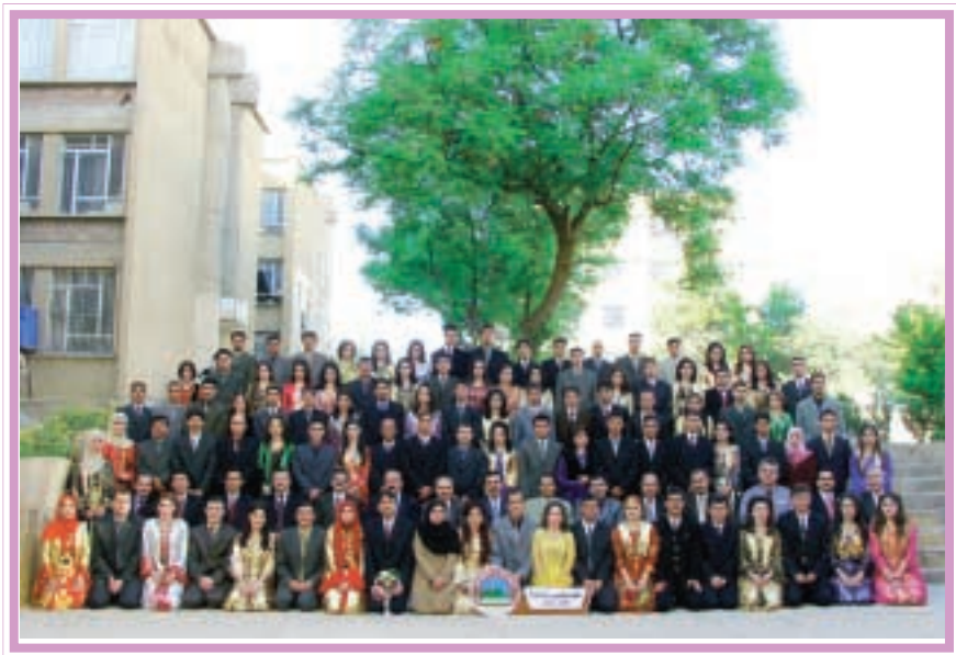
دەرچووانی کۆلیجی یاسا