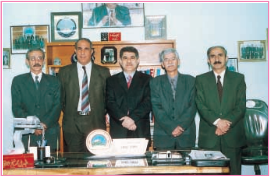
تہنجومہنی کوليجی پزیشکی دہان