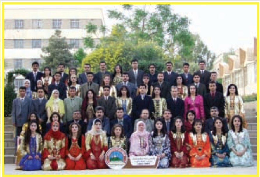
دەرچووانی کۆلیجی زانستی مرۆڤایه تی / جوگرافیا