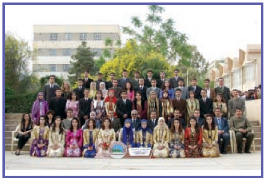
دهرچووانی کۆلیجی زانست / بایۆلۆجی