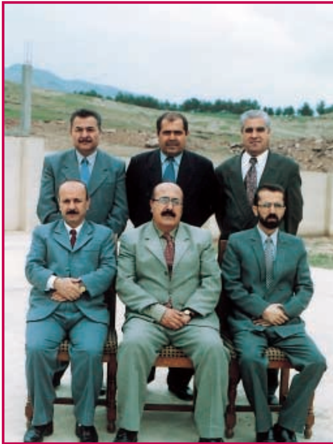
تہنجومہنی کوليجی پھروہرکھ