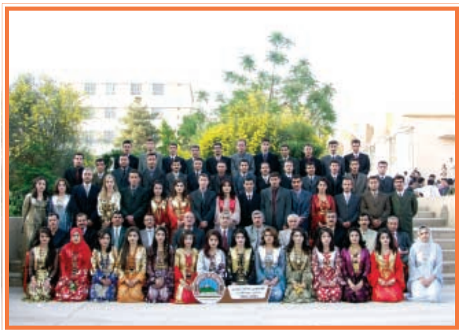
دەرچووانی کۆلیجی ئەندازباری / بیناکاری