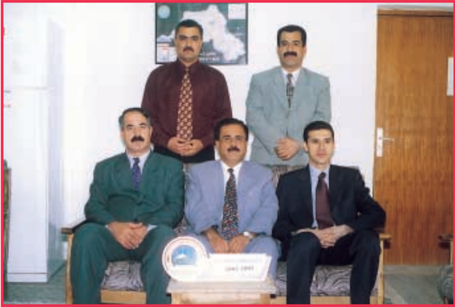
ئەنجومەنى كۆلېچى پەروەردەھى وەرزىش