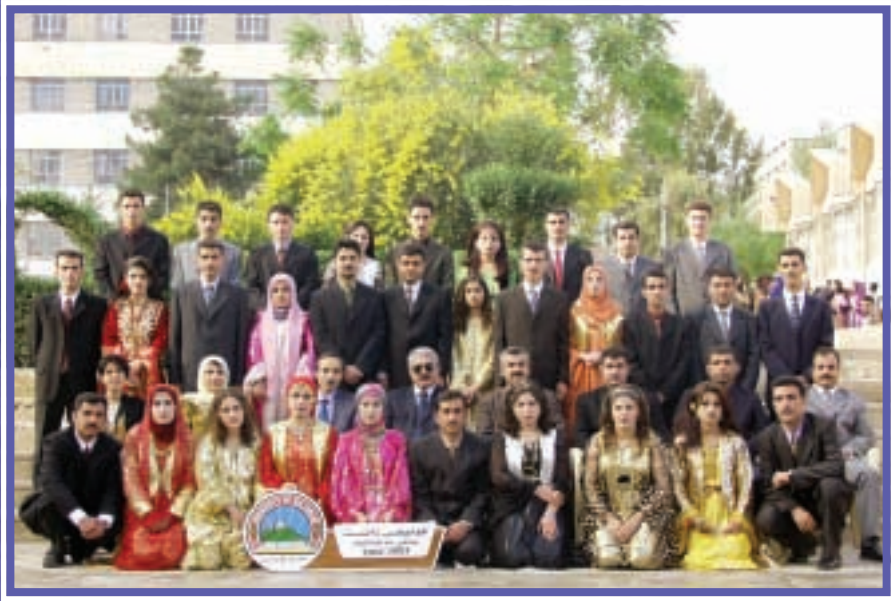
دهرچووانی کۆلیجی زانست / ماتماتیک