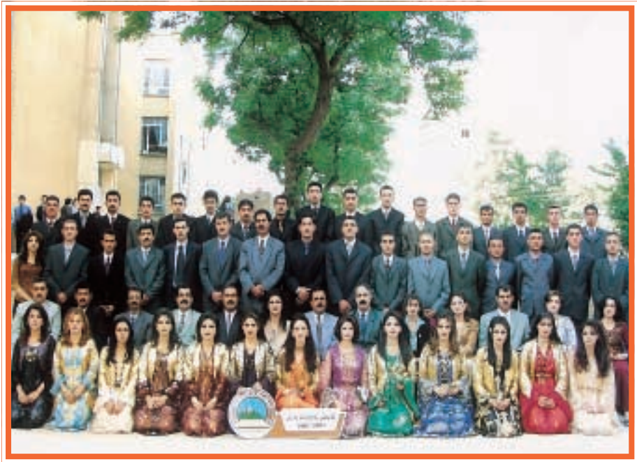
دەرچووانی کۆلیجی پەروەردەیی وەرزش