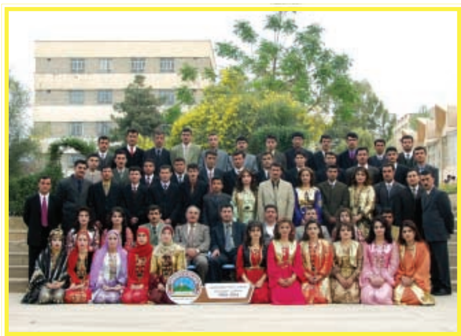
دەرچووانی کۆلیجی زانستی مرۆفایه تی / میژوو