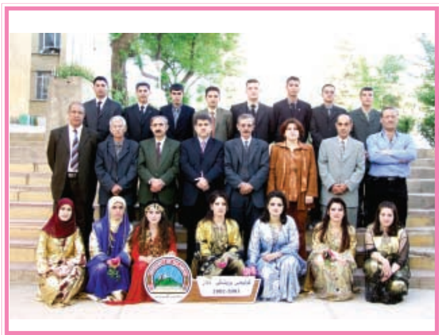
ده‌چوانی کۆلیجی پزیشکی ددان