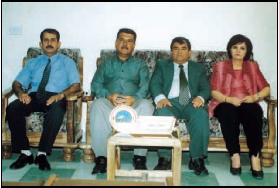
تەنجومەنى كۆلئىچى پەرىستارى