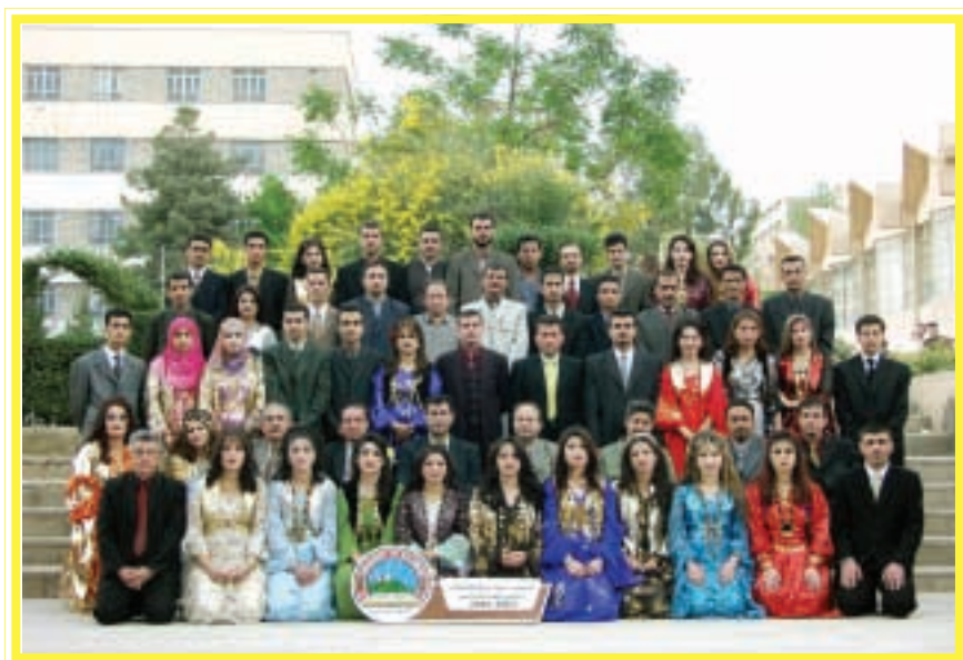
دەرچووانی کۆلیجی زانستی مرۆفایه تی / کۆمهڵناسی