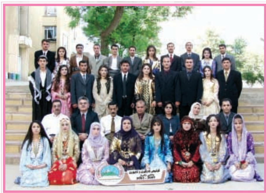
دہرچووانی کوليجی کارگيڙي و ٺابووري / ٺامار