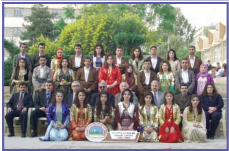
دهرچووانی کۆلیجی زانست / کیمیا