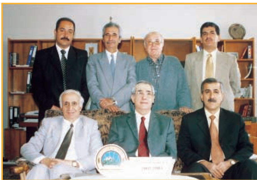
تەنجومەنى كۆلىڭى تەنئازىارى