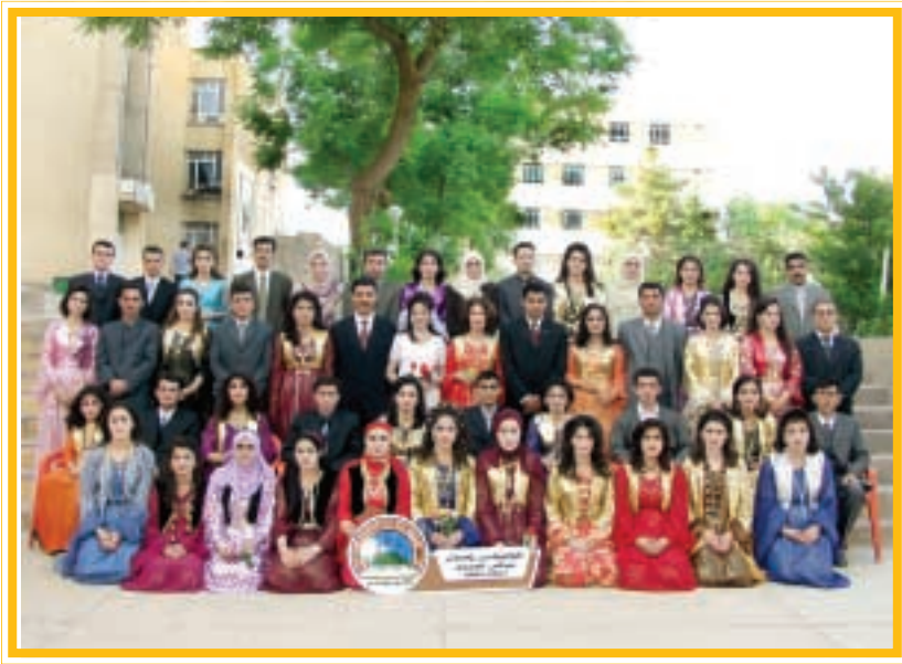
دەرچووانی کۆلیجی زمان / کوردی