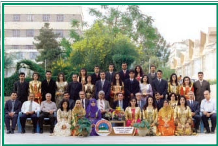
دهرچوانی کۆلیجی کشتوکاڻ / باخداری