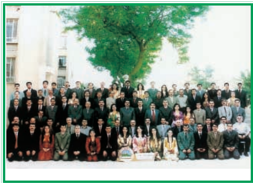
دەرچوانی کۆلیجی یاسا/ئیتواران