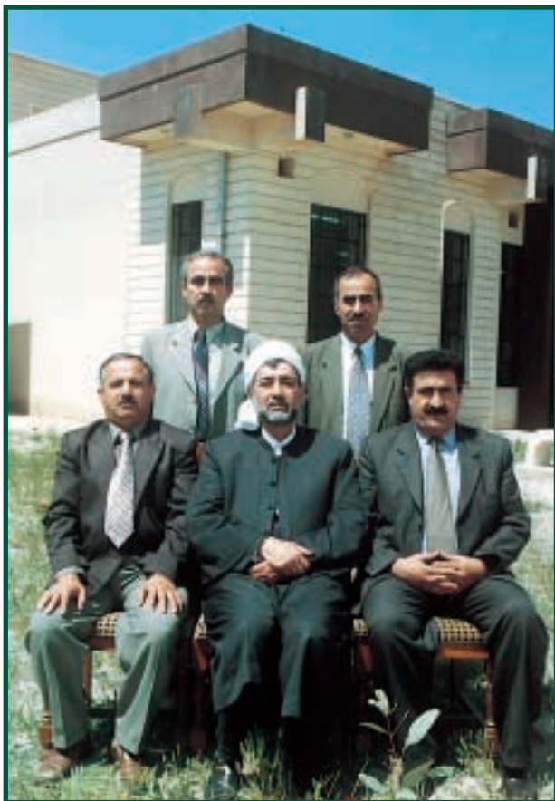
تەنجومەنى كۆلجى شەرىخە و ياسا