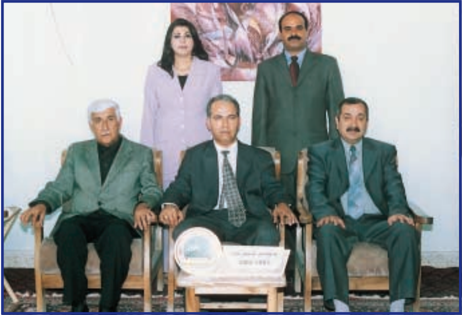
تہنجومہنی کۆلیجی ہونہر