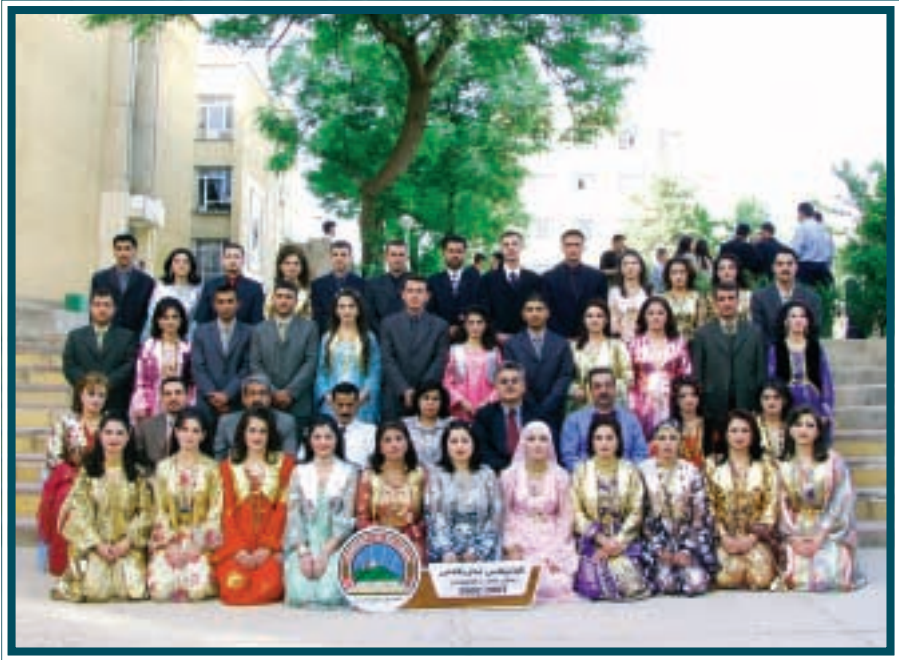
دەرچووانی کۆلیجی بازرگانی / ئامار و کۆمپیوتەر