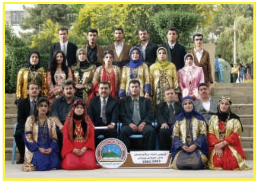
دەرچووانی کۆلیجی زانستی مرۆڤایه تی / خویندنی ئیسلامی