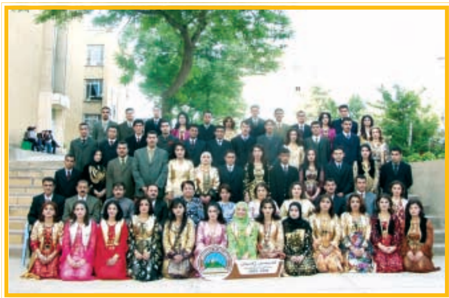
دەرچووانی کۆلیجی زمان / ئینگلیزی