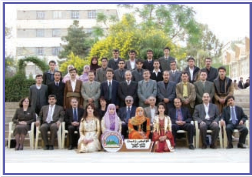
دەرچووانی کۆلیجی زانست / فیزیا