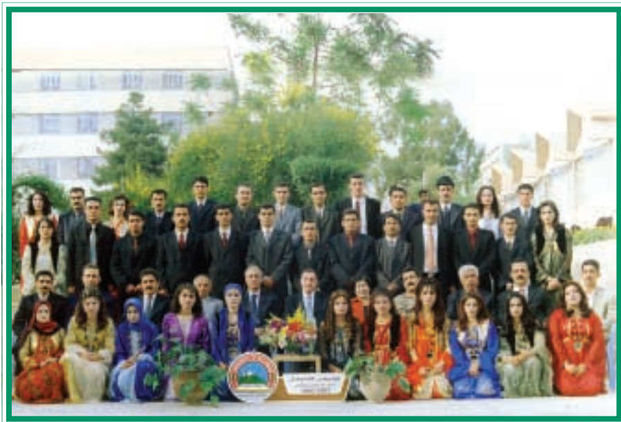
دهرچوانی کۆلیجی کشتوکاڻ / بهروبومی کیتلگهیی