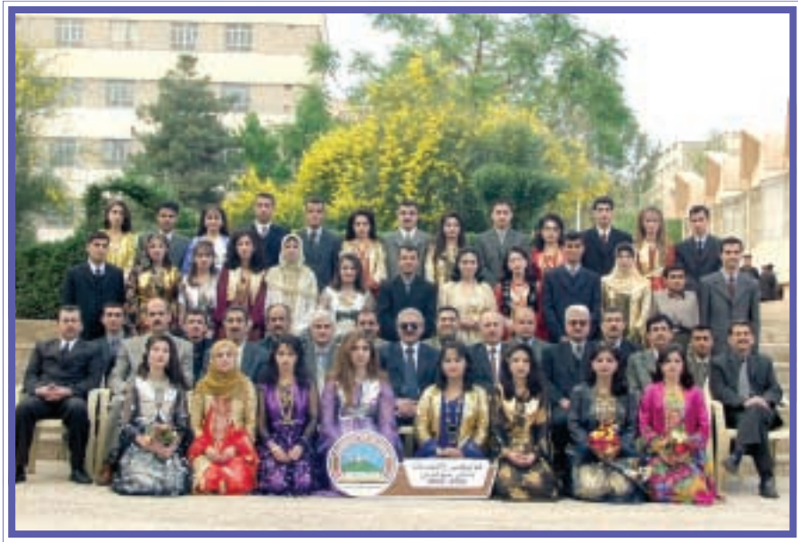
دهرچووانی کۆلیجی زانست / جیۆلۆجی