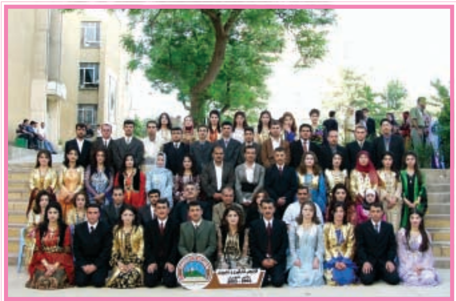
دەرچووانی کۆلیجی کارگێری و ئابووری / ئابووری