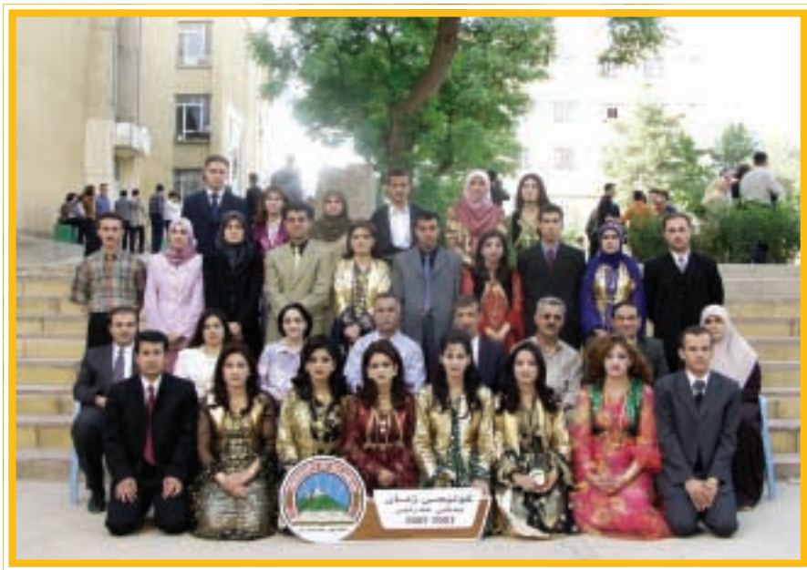
دەرچووانی کۆلیجی زمان / عەربی