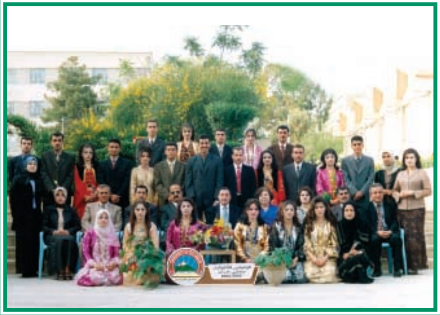
دەرچوانی کۆلیجی کشتوکاڤ / خاک