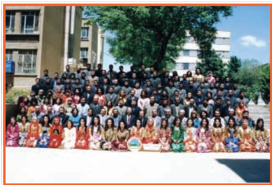
دەرچووانی کۆلیجی پزیشکی