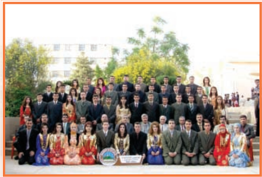
دەرچووانی کۆلیجی ئەندازاری / ئاودیری