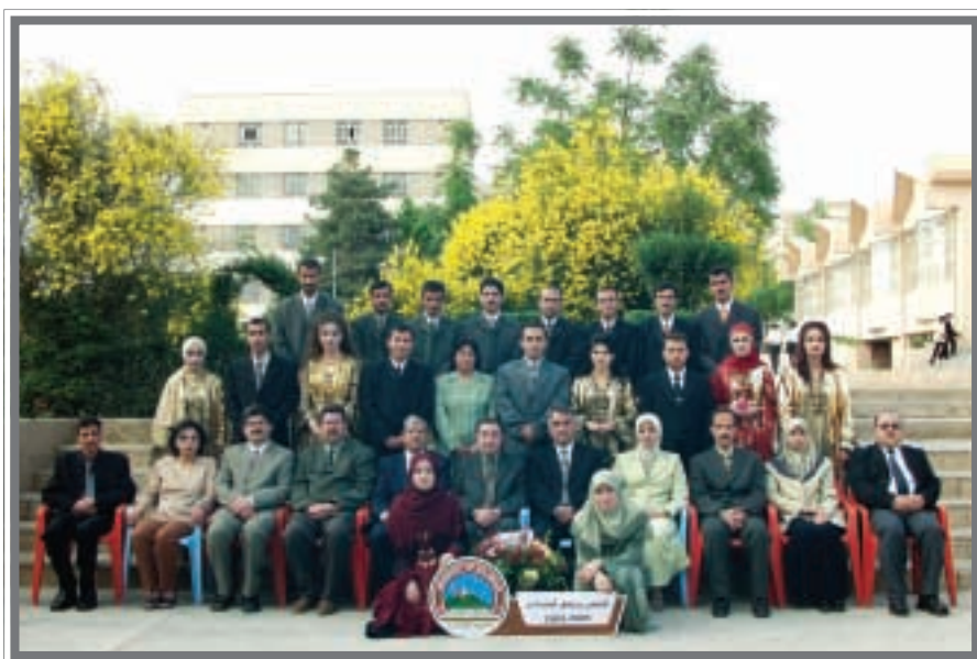
دەرچووانی کۆلیجی پزیشکی فیتیرنەری