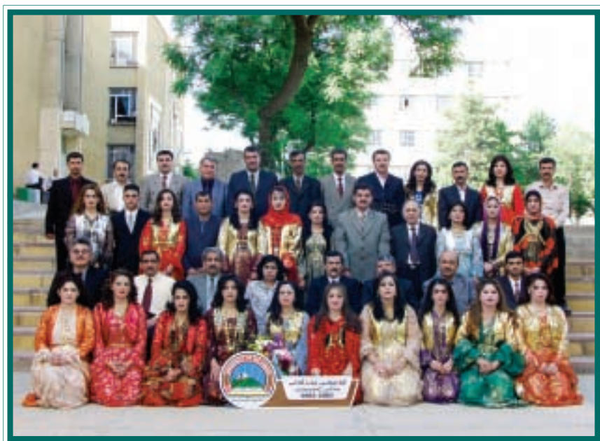
ده‌چوانی کۆلیجی بازرگانی / ژمیریاری