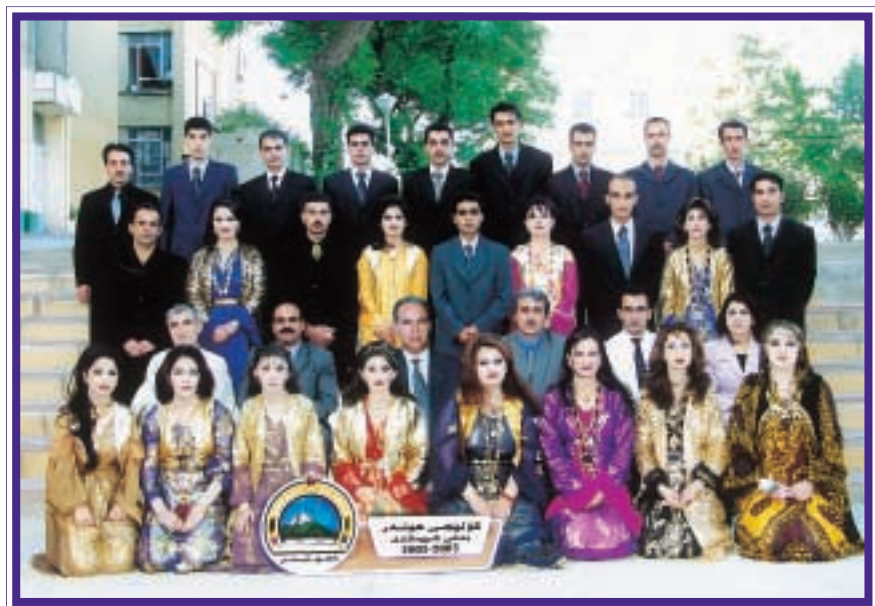
دەرچوانی کۆلیجی هونەر