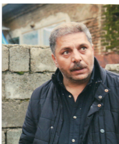
نووسینی نازاد پینجیوینی پایزی ۲۰۱۸