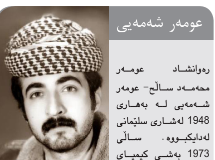
عومه ر شه مه یی

ره وانشاد، عومه ر محمه د صالح - عومه ر شه مه یی له بهاری 1948 له شاری سلیمانیه له دایکبووه. سالی 1973 به شی سلیمانیه کولژی زانسته کانی