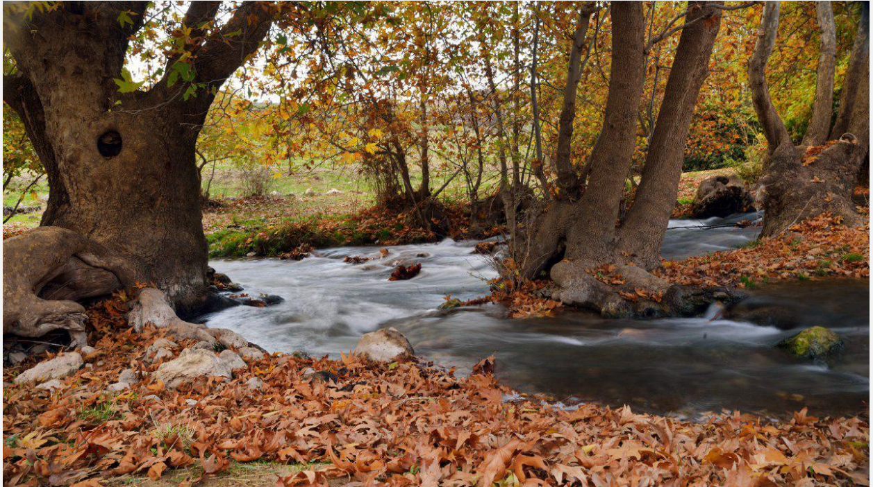
📷 Dûrzan Cîrano