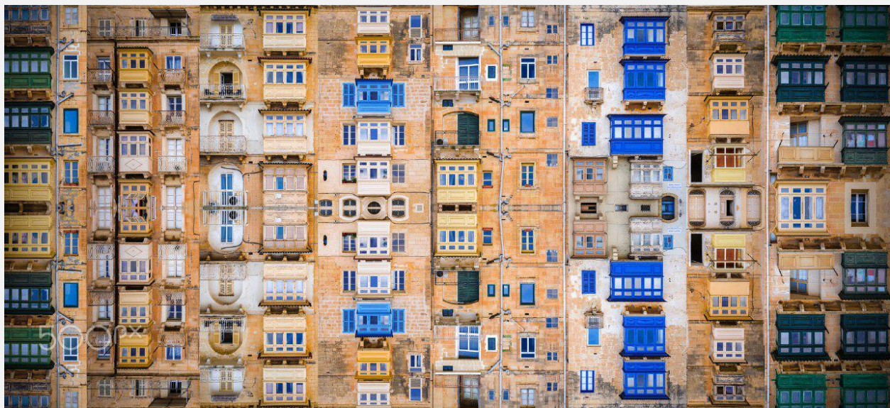
📷 Damien Tachoures