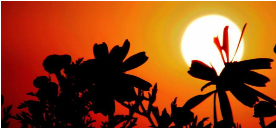
📷 Fragile Appunto