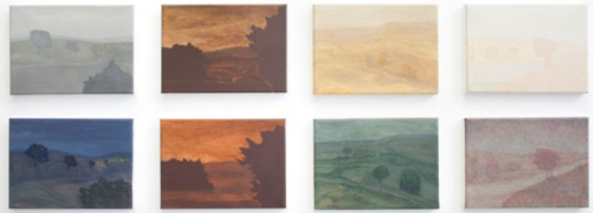
Aghjalar2010 Acrylic on canvas 24 x 18 cm (8x) 2015