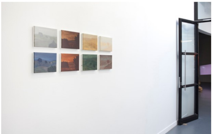
hibition overview TENT Rotterdam 2015