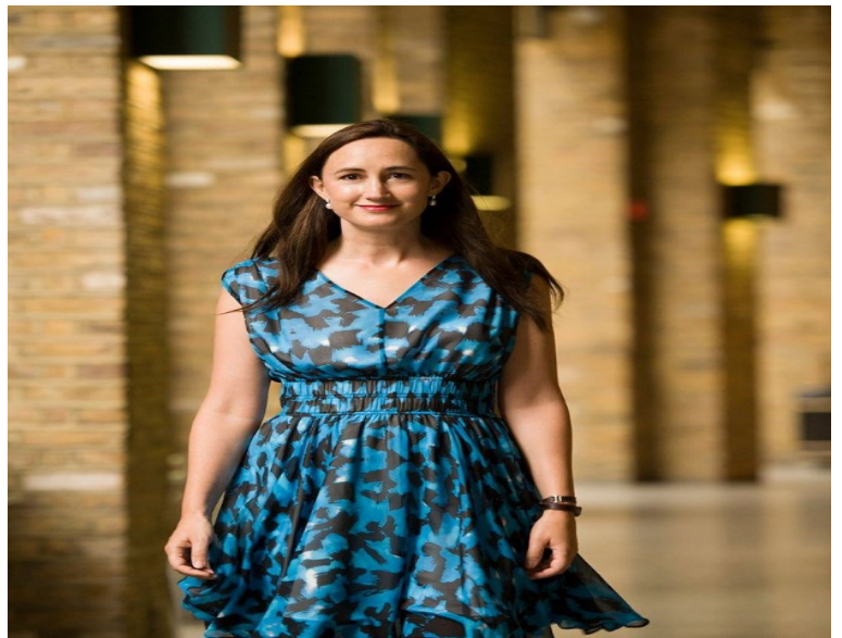
له (ئهدب و هونه)دا بلاوکرودهتهوه

من له کاتی نووسینی كتیبيکی نویدا زۆر به نهپنی ئيش دهکم. به رای من نووسهران كه سانی ناسکن و ئاسان زيانيان پيدهگات، وهکو پهپوله وان به ئاسانی لول دهن. نهگهري تۆش وهکو من كه سيکی ههستياری، دهربرینی دوودلی و رای خراب له لایهن كه سانی ترهوه لهوانهیه متمانهت بهخۆت سهبارت به نووسینی رۆمانهكەت ورد و خاش بکات. به رای من باشتر وایه راهیتان و نووسينهكانت به شپوهیهکی تاکه كه سی بیت، چونكه لهو حالتهدا به نازادی تهواوهوه بهبئ نيگهرايی له راو حوكمی كه سانی دی و نهوهی نهنجامی نووسينهكەت چی دهبيت دهتوانی بهباشی ئيشی خۆت بکهی. ههر نهوهندهی رۆمانهكەتت ئاشکرا کرد و خسته بهردهم راو حوكمی كه سانی ترهوه کۆسپ له بهردهم داهیتاندا دروست دهبيت. تهنيا كه سيك كه نووسينهكانی نیشان دهدهم هاوسههکهمه و نهویش له دمیكهوه بهپنی نهوهی لهسهری ريکهوتووین به وردی دهزانیت نهو شتانه چين كه نابی باسیان بکات. به رای من رۆمانیک كه خهريکی دهينووسیت شتيکی زۆر به بههايه و له ههمانکاتدا نادياریکه كه به ئاسانی زيانی بهردهکهويت و نابووت دهبيت. بۆیه دهبيت به باشی پاريزگاریی ليکتهیت.