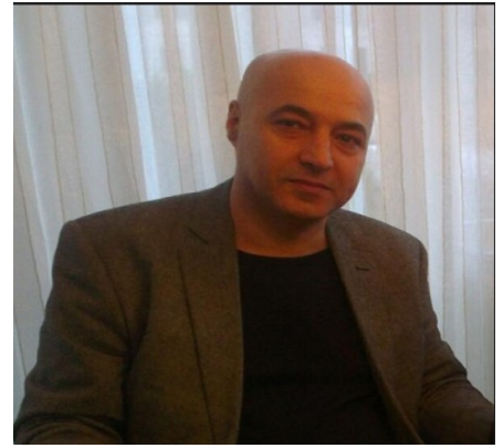
نوسینی به ختیار شههیی- نه مستردام

ئیمه میلله تیکین، به بهراورد له گه ل میلیه تانی دیکه دا، درهنگ دیاردی نویسن و میژوونوسی و بیره وهری نویسی له ناوماندا سه ریانه له داوه. جینگه داخه، زۆربه ی زۆری سه رکرده و ناودارانی کورد، به بی ئه وهی بیره وهریه کانی خۆیانمان بۆ بنوسنه وه، له گه ل خۆیاندا بره وویانه ته نیو تاریکستانی هه تاهه تاییه وه. ئه و سه رکردانه ی که یاده وهریه کانی خۆیانان نویسیه وه، له په نجه کانی یه ک ده ست پتر نین. پیمواییت یه که م سه رکرده و دیبلوماتکاری ناوداری کورد، که یاده شته کانی خۆی نویسیه وه، نهر ژینه رال شه ریف پاشای خندان بوو بیت. پاشان، نهر ئیحسان نوری پاشای سه رکرده ی راپه رینه کانی ئاگری و ئه راراتی باکوری کوردستان دیت. له سیاسیه کانیشمان، نهرمان ره فیک حیلمی و ئه حمه د خواجه و ئه حمه د ته قی و شیخ له تیغی شیخ مه حمودی نهر و.....هتد، بیره وهریه کانی خۆیان نویسیه وه. لیره دا ناکریت ناوی هه مووان ریز بکرین، به لام شایانی باسه، که له م سالانه ی رابورده شدا، چه ندین سه رکرده و سیاسه تمه دار و فه رمانده و پیتشمه رگه و نوسه ر و هونه رمه ند و روناکبیر، بیره وهریه کانی خۆیانان بۆ نویسیه وه و نامه خانه و میژووی کوردیان ده وله مه ند کردوه و چاو و دلّی خۆینه رانیشیان پۆشن کردۆته وه. یه ک له و پیتشمه رگه و فه رمانده ئازا و دلّسۆزانه ی، که بیره وهریه کانی به پاکى و دلّسۆزانه و راستگۆیانه بۆ نویسیه وه، گیانبه خشیووی نهر (پیباز) ه، که جیاوازه له هه موو ئه وانى دیکه.