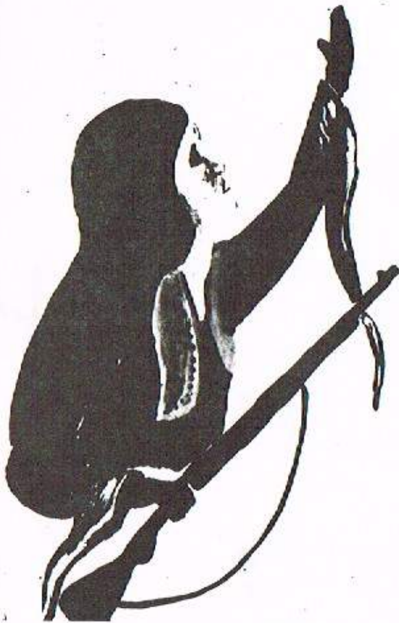
ده سترګدی /