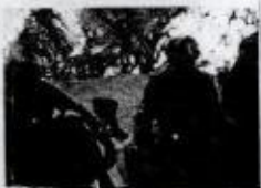
شەھىد كەتتى حاجى موشىر + د. كەمال خۇش تارە + مىسالار