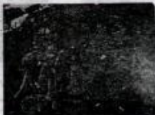
حاجي حاجي خالو + علي بيجكول + عزيز بيگ + دوسمان بيگ / ۱۹۶۹ / تالكان