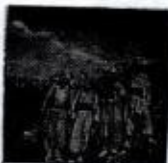
سام سەلیح گۆز مەسەپی + نەوای جەمەل مینا + شەهید گۆزەن تەلەز مینا + ... / ١٩٧٩ نەوای