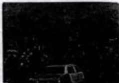
هێتا نەوای نەرمی شەهید مەلزم نەوای نەوای بەگەنەنەگەن ١٩٨٢/١٢ نەحمەد نەوای