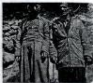
شہید کرم عبداللہ + امام کرم شہید / ۱۹۷۹ / امریکہ سورین