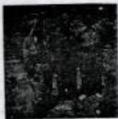
سوار تاشا + شهید جمال ناوگردانی + عزیز بهگ/۱۹۸۰ پانگان