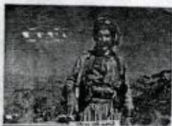
شہید قاسم مستکان / ۱۹۸۶ / بمبائی عراقی