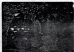
حامی حاجی خالد + علی بیگڑل + مستظا چاورہش / ۱۹۸۰ / نوارنگ