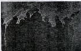
پوليتک پيشميرگه که تهرين شهيد شيخ بابہ رسول پان پير / ۱۹۸۰ / سورين