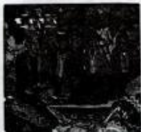
تۇلۇقسى حاجى + گىرىيسى حاجى + مىلانم سىيىف اللە + مەسجىد تۇلۇقسى / ۱۹۸۶ نەرمەك تۇرە / سۈرۈن