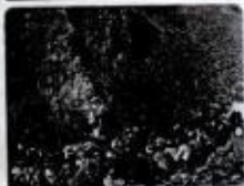
حاجى حاجى بىرايم + شىروان شىرومىشى + كۆمەلئى پ + ۱۹۸۶ نەرمەك تۇرە / سۈرۈن