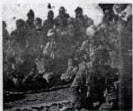
كۆپۈر تەۋەدى كاتىپى، ھۆزى