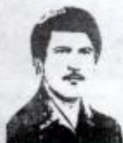
شہید شیرکزی شیخ علی