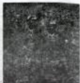
پۆلېك پېشمانگه‌ي شهيد