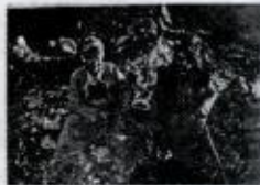
شیروان شیروندی + شعید حاجی عبدالله / ۱۹۸۱ / سورین