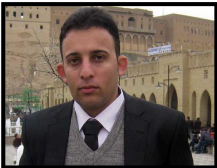
وەرگێر: هوشنگ قادری

ئازادی رادەبرین، بە بناخەیی یەکیک لە ئازادییە مەدەنیەکان چاوازی دەکرێ، کە هە ئگری هەر دوو یەوێندەیی نووسراو و گوتارییە، لە ژۆرەیی پێناسەکان بریتیە لە خۆنەئدن جیا لە زمان وەک جەلەرگ، هە ئپەرگ و موسیقاش دەگرتەووە. لە یەکەم روانین، ئەو روانگەیی هەیی کە ئەگەئ دیموکراسی یەوێندەیی ئاشکراو راستەوئۆی هەیی: رادەبرینی ئازاد پێویستی دیموکراسی و دیموکراسی پێویستی بە رادەبرینی ئازاد هەیی. بە پێچەوانەیی، سیستەم تەواو خاوازیەکان لە ئازادی رادەبرین بەرگێری دەکەن چونکە هەر شە لە سەقامگیری ئەوان دەکات. سەدی سیستەم پشت راستی دواپێن جوکی خۆی دەکا. بۆ نموونە لە شۆرموی یەگرتوو (رابردوو) هەر جۆرە رادەبرینیکی سیاسی- لە رۆژنامەکان، گۆقارەکان، کتێبەکان، رادیو، تەلویزیۆن، لە ژێر زخنی زبانی کەمبەیی دەبوون: هەموو کە ئتۆرە گشتییەکانی تر وەک ئەدەبیات، موسیقا، هە ئپەرگ و هونەری و ئنکاردن دەبوایە رادەبرینی "واقع خاوازی سوسیالیزمی" هەبێ. بە وەییە کە چاوەمەنیەکان، رادیو و تەلویزیۆن، گروپەکانی سەما، شانۆکاری، و هاوشیوەکانیان، هەموو لە خاوەنداریتی دەوڵەتدا بوون، ژۆرتی دژبەران یان جیا بێران دەتوانرا لە شیوی پێبەشکردنی ئەوان لە ئامرازەکانی رادەبرین بێدەنگ بکری.