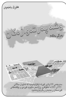
به‌ره‌مه‌کانی نووسه‌ر هاورێ باخه‌وان