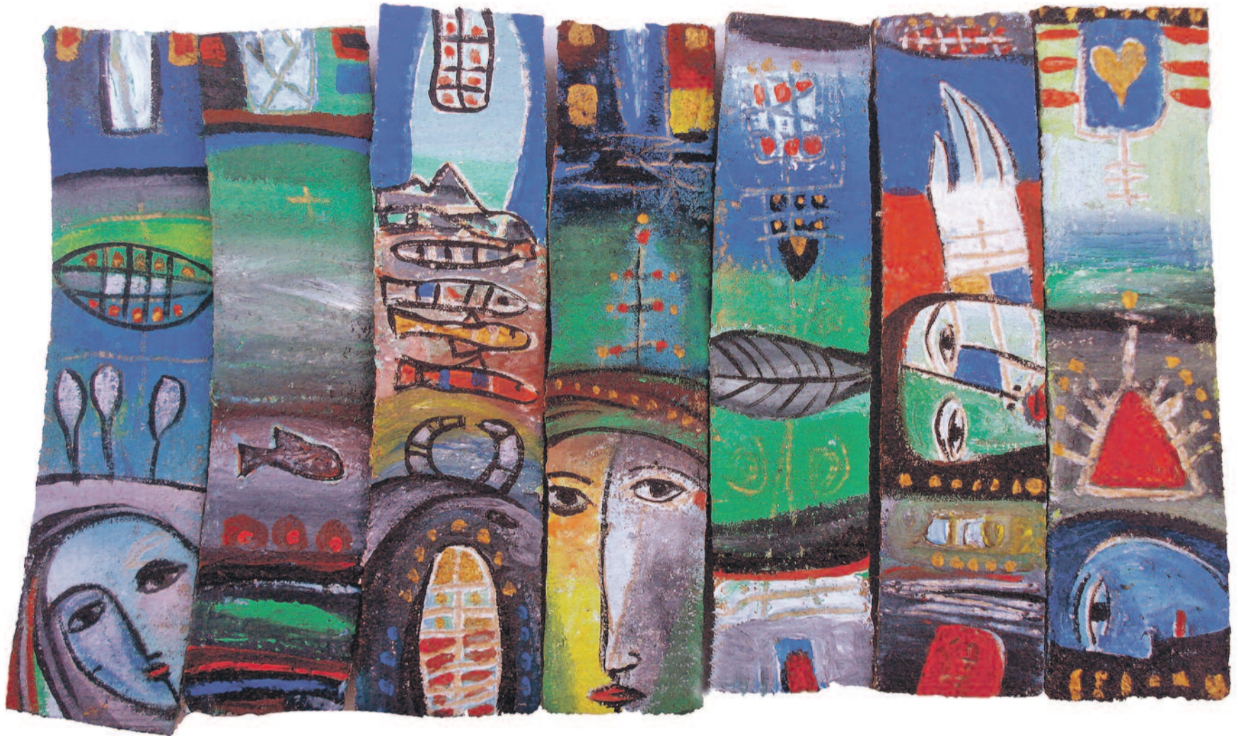
Rebwar Saeed, (Acrylic on wood)

belê ev nayê wateya ku Ewrûpa wê bikeve bin bandora Amerîka'yê û ji daxwazên wê re serî deyne. Ji ber ku Ewrûpa xwe mîna dayîka Amerîka'yê dibîne ew naxweze ti car bikeve bin bandora yekser a serdestiya vê hêzê. Digel ku hêzên rastgir li Ewrûpa'yê xurt bûne û di pir welatan de bûnin desthilatdar, wisa dixûyê ku di wêneyê herî dawî yê siyaseta Ewrûpa'yê de xala ku herî zêde derdikeve pêş ev e: Ewrûpa wê bi rêbazên xwe ên nû nêzîkê Amerîka'yê bibe. Heman nêzîkatî zêdetir di siyaseta wê ya derve de jî tê dîtin. Bêguman bi vê rastiyê ve girêdayî bandora çanda Amerîka'yê jî li heman herêmê belavtir dibe. Herçend rayedarên ewrûpî di zanistiya vê fenomenê de bin, ez bawernakim ku civaka ewrûpî xwediyê heman zanistiyê be.