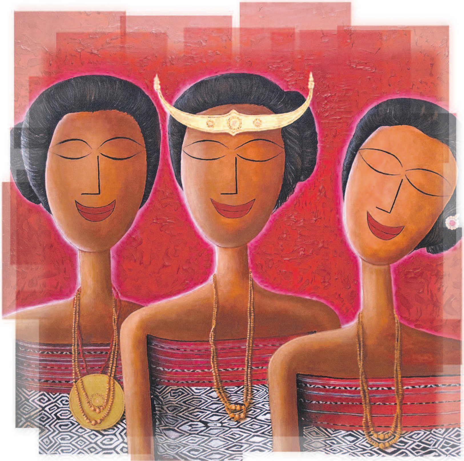
Three Smiling Women, (Kunstschule Arte Moris aus Ost Timur) - Efekt LMD kurdi

ku berê qet nehatiye dîtin. Mij-dara buhurî, FAO'yê, di çarçoveya civîna cîhanî de li ser hêminiya xurekî ya li Roma'yê, diyar kir ku ew digel Konferansa Neteweyên Yekgirtî li ser Bazirganî û Geşepêdanê (KNYBG), FIDA û Banka Cîhanî dixebite ji bo dariştina "qanûna reftara durist" ji bo veberhênên biyanî. Sazkarî û qaîdeyên navneteweyî dikarin, herwiha, rêyê li ber projeyên veberhênên çandiniyê yê "xwedan-mesûliyet" xweş bikin.