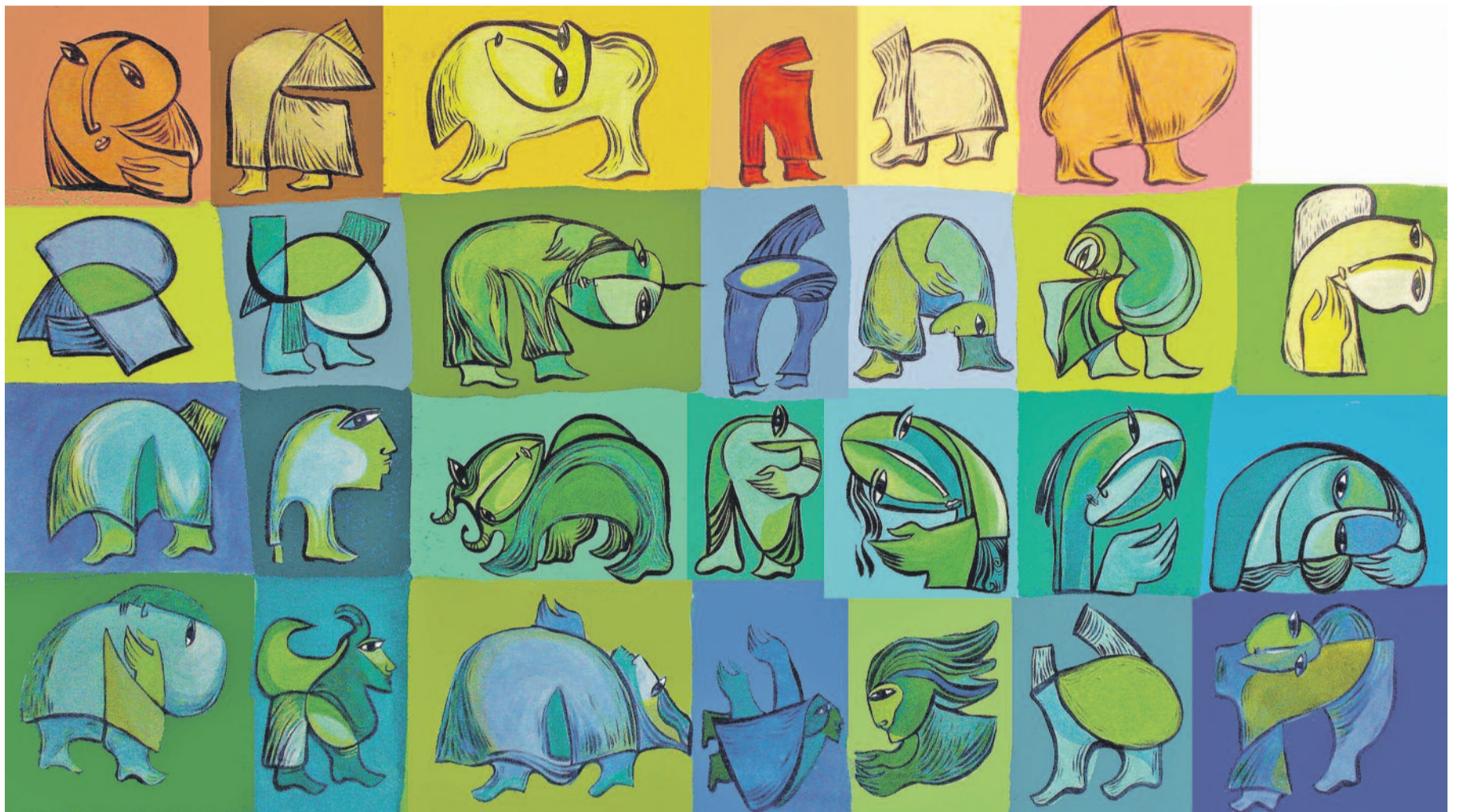
Rebwar Saeed, (Acrylic)

PESC were derxistin, tevî ku di prensîbê de Nûnerê Bilind divê serokatîya Konseya Wezîrên Karê Derve bike. Çileyê bê Spanya'ya ku wê rêveberiyê bigre destê xwe, xuya ye hem-fikr e. Hingî, eger karên derve yên Yekîti'yê beriya Peymana Lîzbon'ê ji aliyê sê seriyên ve dihatin rêvebirin, piştî peymanê mumkin e ev bibin çar serî.