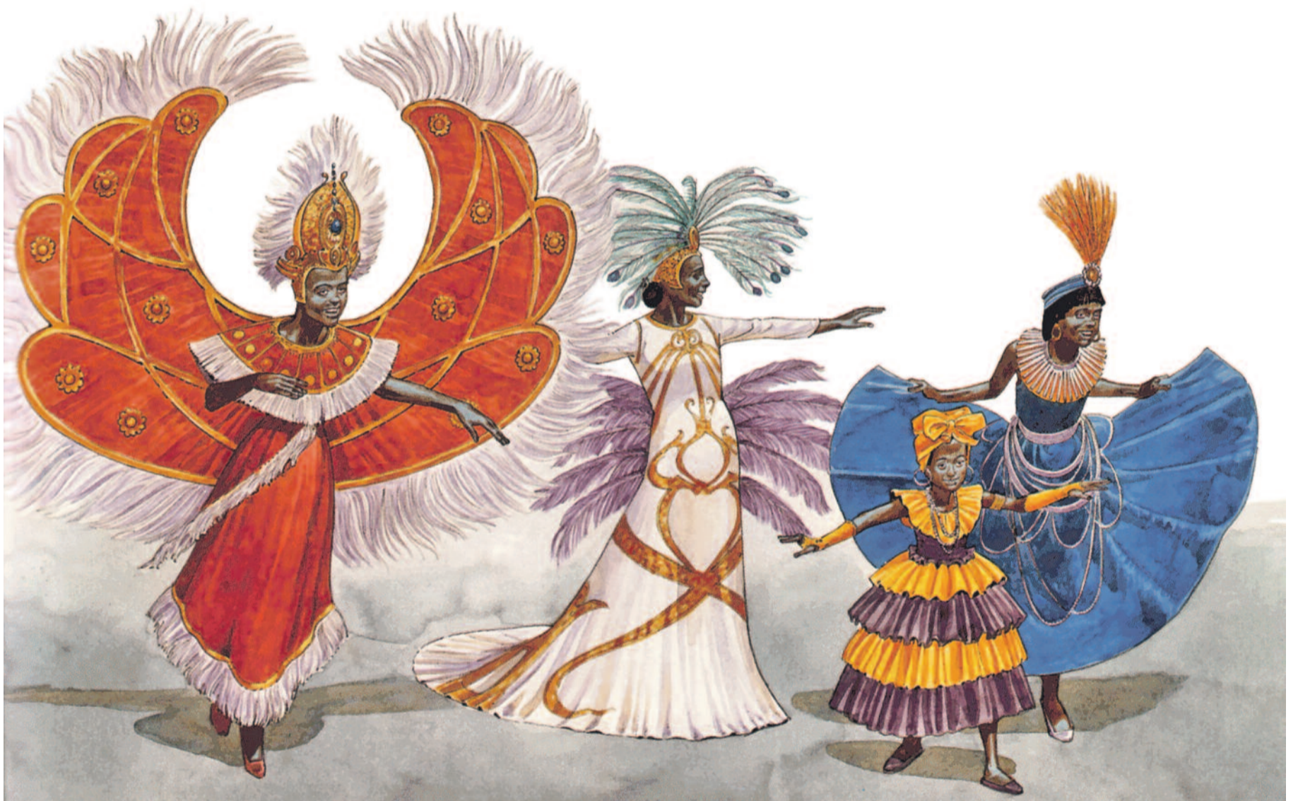
Brezîlya li xwe digere

“ C ihê şermê ye ku Brezîlya pêşwaziyê li serokê rejîmeke dîktator û zordest dîke. Ragirtina peywendiyên dîplomatîk digel dîktatoran tiştek e, pêşwazîkirina serokên wan li mala xwe tiştekî din e (1).” Parêzgarê Sao Paulo’yê Jose Serra, ku yek ji kesayetên serekî yê muxalefeta li dijî Serokdewlet Luiz Inacio Lula da Silvayî ye, bi van gotinan serdana Serokdewleta Îran’ê Mehmûd Ehme-