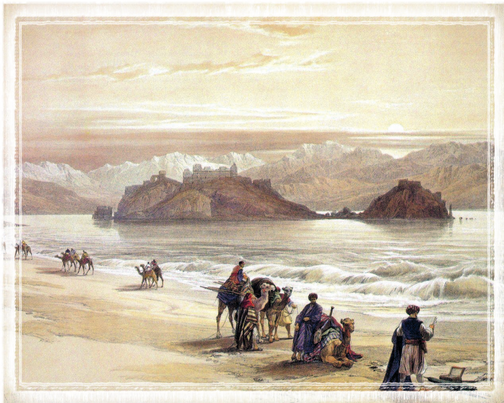
The Island Of Graia, (David Roberts) - Efekt LMD kurdi

şirkatiyên xwe û firotina ber bi derve ve ya navneteweyî dewam bikin û gelek pirsgirêkên hevpar wê çaresernekirî bimînin. Kelevajîtiya vê rewşê bi qasî çanda hevpar midbexa Mexreb'ê û welatên Derya Spî mezin e û ev xwarinên vê midbexê li dinyayê bêhtir tê ecibandin. Reh û kokên vê çanda hevpar digihêjin dirokê, di warê zêdekirina nixên nû de bi tenê bi sazkirina şirketên mekanê wan mexreb û hevkarîya bi şirketên pîrneteweyî yên li herêmê jixwe çalak in mumkin e bîne ziman. Qadên pêkhatina vê yekê jî razandina pereyan, hilberandin û îstîhdam e.