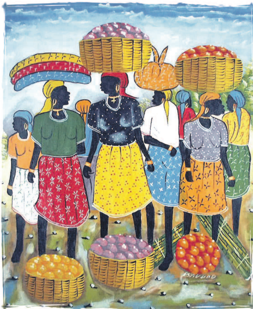
Folk Art Haiti 2008, (Liotino) - Efekt LMD kurdî