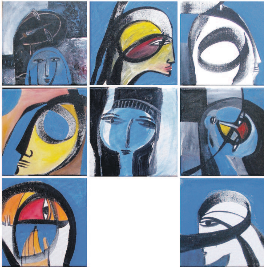
Rebwar Saeed, (Acrylic on wood)