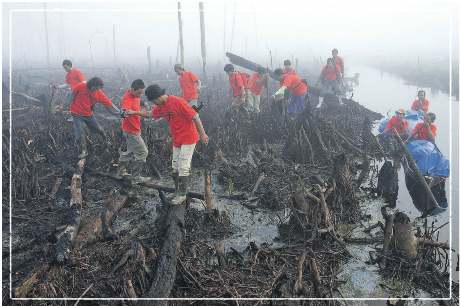
Endonezya xwe dikuje, (Greenpeace) - Efekt LMD kurdi

N êçîrvan û berhevkar bi şiklê nîv-xelekekê kom bûne li meydana bêdar a rêlê ku pêşwazî li zeraqên berbangê dike. Mêrên bişûtik çav li wan biyaniyan kutane. Li pişt wan, jin memik didine bebikan û zarokên ku ji wan mêvanên nepayî tirsîyayî aşt dikin. Menti, pîrmerêkî peyt û rebît ê li dor şêst salî, rûspî û serekê vê koma pênc