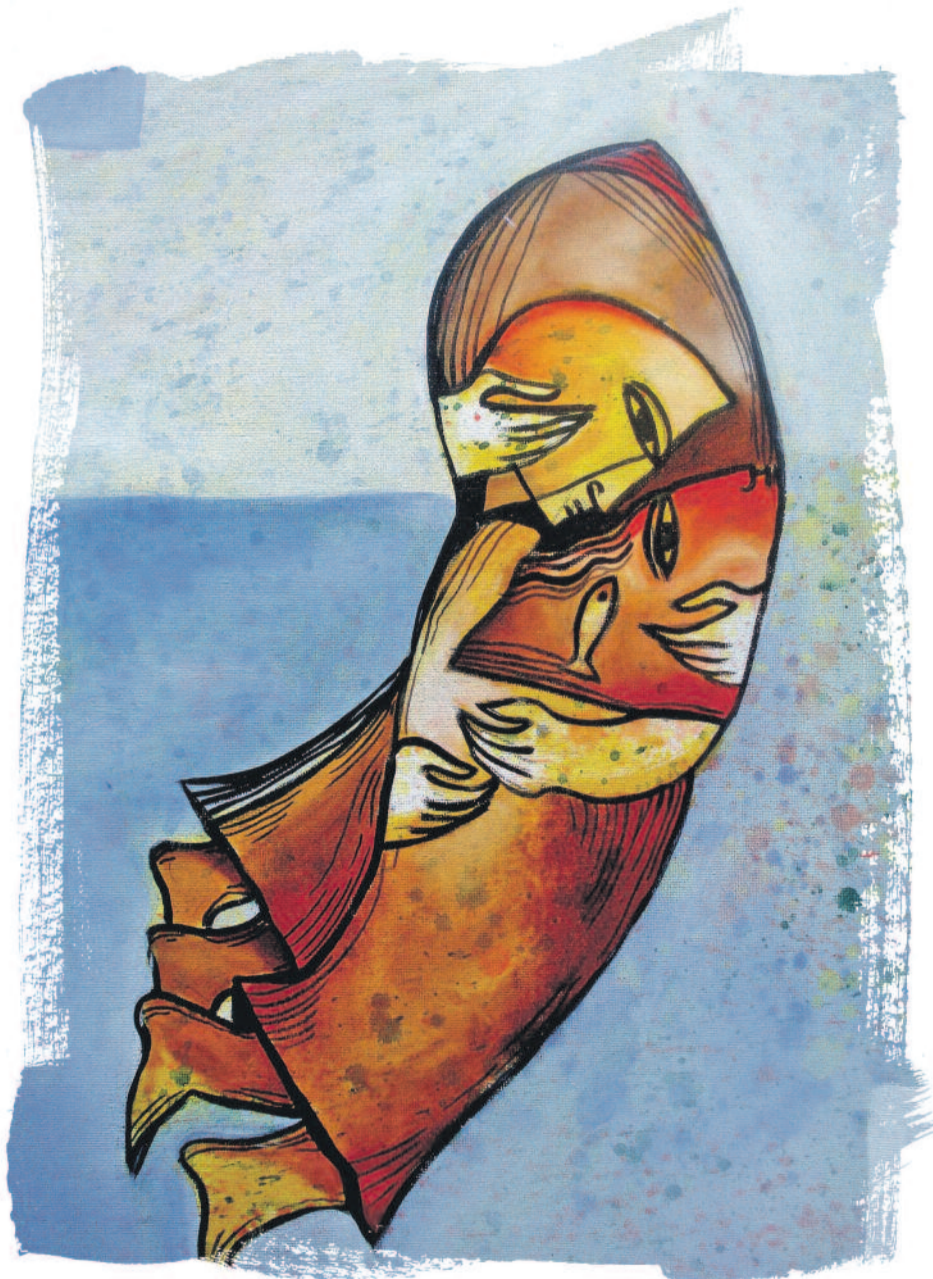
Rebwar Saeed, (Acrylic on canvas) - Efekt LMD kurdî

handinê (bi kurteya TIC tê nasîn) av didin, û di raya giştî de wê baweriyê durist dikin ku çaxekî nû dizê: çaxê rûken û zêrîn ê bi navê "civaka enformasyonê."