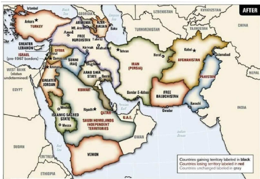
ھەولەكانمان لە سە ساڵەى رابردووەو بۆ گەورە كردنى داواى گەلى كورد بۆ يەك گرتەوہى كوردستان و سەربەخۆيى ئەو نەخشەى بەدەيئناوہ كە پانتاگوڤنى ئەسەريكا دروستى كردوہ.