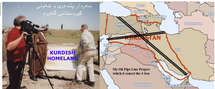
It is time for the West and the East to sport my project for Re-Establishing Oil and Gas Pipe Line to connect the 4 Sea by creating the great Kurdistan

بەردەوام كار دەكەين و پىرۆژە بەدواى پىرۆژە دادەريژين بۆ يەك گرتەوہو سەربەخۆيى كوردستان