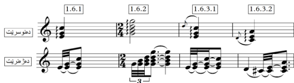
نموونه (7) پروونكردنه وهى شيوهكانى ژهينى ئارپيجيو.

2.8 گلىساندو (Glissando): - وشەكە ئىتالىيە، لە وشەى (Glissar) ى فەرەنسى وەرگىراوھە. زۆر جار بۇ (Gliss) كورت دەكرئىتەوھە و بە ماناى خشاندىن يان خزاندىن دىت. واتە ژهين بە خزاندىن پەنجە لە سەر نۆتەيكەوھە بۇ نۆتەيكە دىكە بۇ خواروھە يان بۇ سەرھەو. ھەرۆھە پۆرتەمىنتو (Portamento) كە بە ھەمان شيوه وشەيكە ئىتالىيە، زۆرجار بۇ (port) كورت دەكرئىتەوھە و لە زمانى موزىكدا بە واتاى بردنى دەنگىك بۇ دەنگىكى دىكە دىت. لە تيورى موزىكدا بىروپاى جياواز لە بارەى بەكارھىنانى ئەم دوو ئۆرنەمىنتە ھەيە. كە ھەندىك پۆرتەمىنتو بە گلىساندو كورت دەستىشان دەكەن. ھەرۆھە ھەندىك بۆچوونى دىكە دەلئىن گلىساندو بۇ ئامپىرە ژىدارەكانە و پۆرتەمىنتو بۇ ئامپىرەكانى شيوه پىانو و ھارپ و فۆدارەكانە. ديارە لە كۇندا پۆرتەمىنتو زياتر بۇ دەنگى مروى بەكارھاتوھە. وهك لەم نموونەى خواروھە شيوهى گلىساندو و پۆرتەمىنتو خراونەتەروو. (تازىد. جەلىل، ۲۰۱۶، ل۱۹۰).