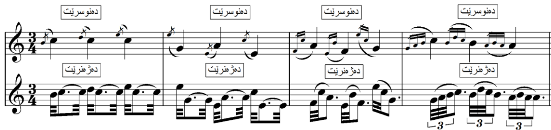
نموونه (6) پروونكردنه وهى شىوهى ژهينى نۆتهى ئەكسيكانتورا.

2.7 ئارپيجيو (Arpeggio): - وشەى ئارپيجيو واتە ژهين بەشيوازى ئارپيج، وهك شيوهى ژهينى نۆتهكانى ئامپىرى ھارپ. لە بەر ئەوهى لەم ئامپىرەدا نۆتهكانى كۆرد، ھەميشە لە خواروھە بۇ سەرھەو بەدواى يەكدا دەژنرئىت، ھەميشە لە سەرھەتاي تىرپە دەست پىدەكات و ھەرىكەك لە نۆتهكانى تا كۆتايى كۆردەكە دريژدەكرئىتەوھە و بەچەند شيوهەيك بەكارديت، وهك لە خواروھە پروون كراونەتەوھە.