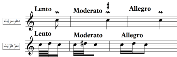
نموونه (۲) روونكردنه وهى چۇنبيه تى ژەنين و نوسىنى مۇردىنت.

2.3 مۇردىنت (Mordent) :- بهم هېمايه (♩) له سەر نۆته دادەنرېت. به هەمان شىوهى مۇردىنتى سەر وو نۆتهى سەرەكى دەنەخشىنتى و دەيكات به سىن كەرت. به لام كەرتى دووهى له پرى ئەوهى نۆته يەك سەر وهى نۆتهى سەرەكى يىت نۆته يەك خوار وهى دەيىت. واتە (كەرتى يەكەم = به نۆتهى سەرەكى، كەرتى دووهم = به نۆته يەك خوار نۆتهى سەرەكى، كەرتى سىيەم = به دووپات بوون وهى نۆتهى سەرەكى). هەندىك جار هېماي دىز يان بيمۇل له ژىر هېماي مۇردىنت دادەنرېت، بۇيه كار له نۆته كەى خوار نۆتهى سەرەكى دەكات كه برىتبيه له كەرتى دووهم. وهك لهم نموونهى خوار وهى روونكراوه تەوه. ( هالست. ئىمۇجن، ۲۰۰0، ۲۴۹ل).