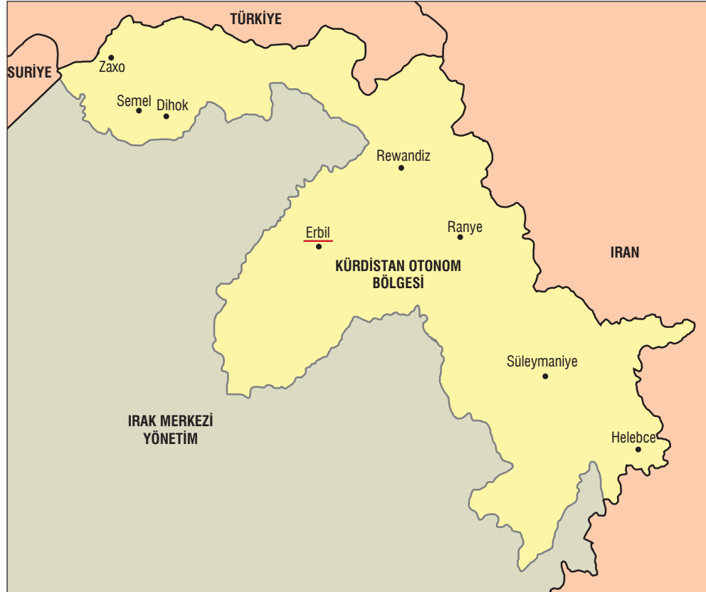
Harita 2: 1975 Kürt Otonom Bölgesi

Irak'ta 14 Temmuz 1958'de Abdülkerim Kasım liderliğinde gerçekleşen askeri darbenin ardından o güne kadar yer altında örgütlenen KDP serbest bırakılmış ve Barzani'ye de Sovyetler Birliği'nden geri dönme çağrısında bulunulmuştur. Aşiretçiliği geri kalmışlığın işareti olarak görmeye başlayan KDP, İbrahim Ahmed'in Genel Sekreterliği döneminde şehirli aydınların etkinliğini iyice arttırması ile de toplumsal destekten önemli ölçüde yoksun kalmıştır. Toplumsal desteği kazanmak adına çelişkili bir tavır da olsa köylü Kürtler ve aşiret grupları arasında etkinliği yüksek olan Molla Mustafa Barzani'ye partinin fahri başkanı olması teklifinde bulunulmuştur (Bruinessen, 2006: 49). KDP'deki bu ikircikli yapı sonraki yıllar boyunca varlığını devam ettirmiş ve aynı zamanda Kürtleri kontrol altına almak isteyen merkezi Irak yönetimi tarafından sıklıkla kullanılmıştır. Öte yandan Abdülkerim Kasım'ın Kürtlerle olan yakınlığı fazla uzun sürmemiş ve merkezi yönetimin Arap milliyetçiliğine