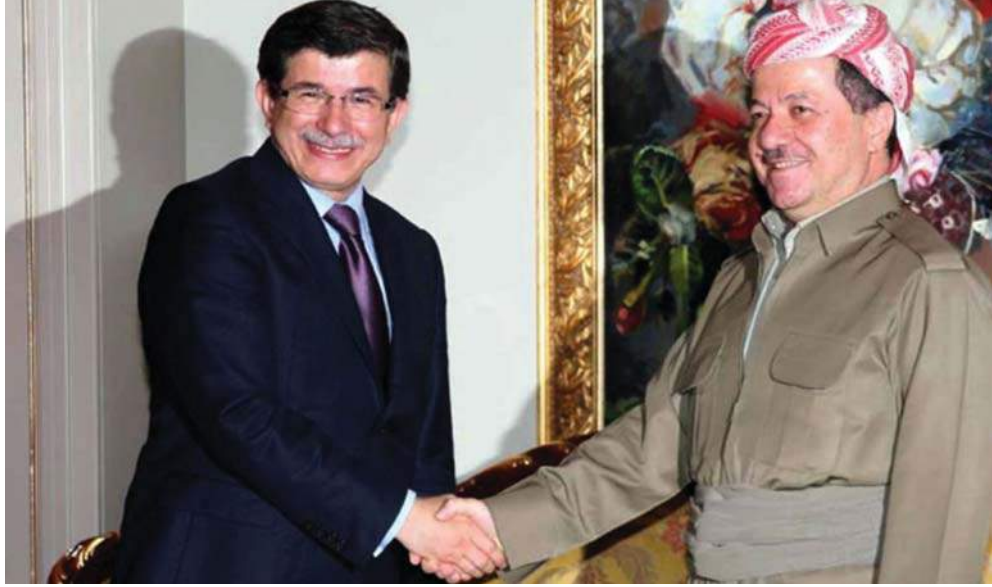
Resim 2: Davutođlu-Barzani Görüşmesi, Erbil

2008 ve 2009 yılları ise Türkiye'nin Kürt Bölgesi ile ilişkilerinde yeni bir sayfanın açıldığı yıllar olmuştur. Türkiye iç siyasetinde güvenlikçi politikanın temel kaynağı olan askerin siyasi alandan tasfiyesi ile dış politikada hükümetin daha etkin hareket edip karar alabilmesi mümkün olmuş ve böylelikle taraflar arasında yakınlaşma ve diyalog imkanı hale gelmiştir. Bu zamana kadar Irak Kürtleriyle inişli çıkışlı fakat sürekliliği olan gerilimler yaşayan Türkiye, artık Kürt Bölgesi'yle ilişkilerini ekonomik entegrasyon ve enerji ilişkileri üzerine tesis etmeye başlamıştır (Balcı, 2013b). 2008'den itibaren başlayan yakınlaşma ekonomik açıdan değerlendirildiğinde tablo daha da netleşmektedir. Örneğin 2004 yılında Irak ile olan ticaret hacmi 1,8 milyar dolar iken 2008 yılına gelindiğinde 3,9 milyar dolara ulaşmıştı. 20 Hızlı bir biçimde yükselişe geçen ticaretin %75 gibi büyük bir payı Kürdistan Bölgesel Yönetimi ile yapılmaktaydı. Fakat olumlu ekonomik göstergeler siyasi gerginlikler yüzünden yavaş ilerlemekteydi. Bundan dolayı siyasi gerginlikler de ekonomik yakınlaşmayla tezat oluşturmakta ve sürdürülebilir görünmemekteydi.