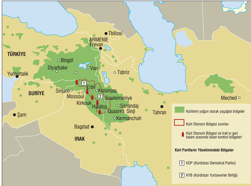
Harita 1: Ortadoğu'da Kürtlerin Yoğun Olarak Yaşadığı Yerler ve Kuzey Irak