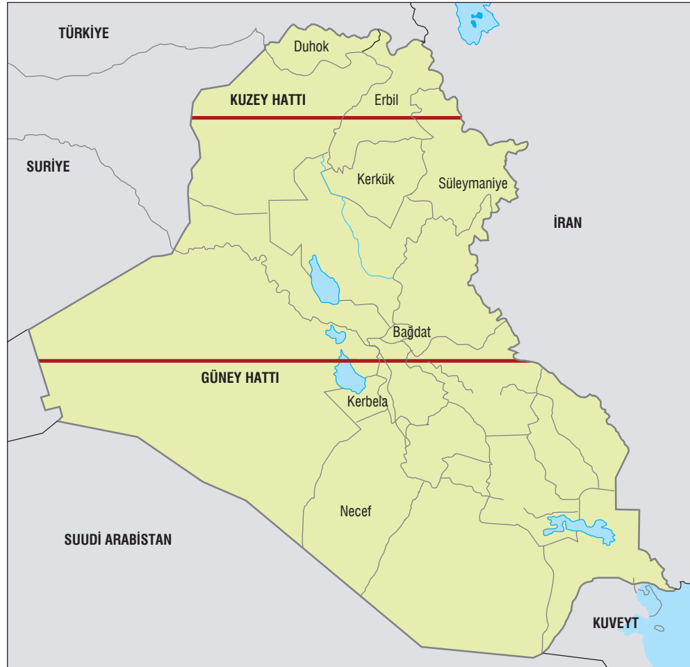
Harita 4: Irak'ta Oluşturulan Uçuş Yasak Bölge

Türkiye'deki kamplara yerleşmiştir. Bunun üzerine Iraklı Kürtlerin ülkede kalmasını istemeyen Ankara yönetimi mültecilerin tekrar Kuzey Irak'a güvenli bir şekilde dönebilmesinin yollarını aramaya başlamıştır. Bu doğrultuda ilk adım olarak ABD ile birlikte hareket eden Türkiye, 6 Nisan 1991'de İncirlik'te konuşlanacak Huzur Ortak Görev Gücü'nün Kuzey Irak'a düzenlenecek insani yardım operasyonlarını yürütmesini kabul etmiştir. Kısa süre sonra ABD yönetimi 10 Nisan 1991'de Kuzey Irak'ın önemli bir kısmının içinde bulunduğu 36'ncı enlemin kuzeyinde uçuş yasağı getirince Kuzey Irak'ta Kürtler için "güvenli bölge" oluşturulmuştur. Daha sonra Huzur Ortak Görev Gücü İngiltere ve Fransa askeri gücünün de katılımıyla Birleşik Görev Gücü adını almış ve güvenli bölgeyi korumak amacıyla Kuzey Irak'a yönelik kapsamlı bir "Huzur Harekatı" düzenlemeye başlamıştır (Bölme, 2012: 344). Haziran 1991'e gelindiğinde Kuzey Irak'ta güvenli bir ortam sağlanmış ve Türkiye'deki mülteciler evlerine geri dönmüştür.