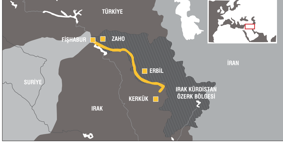
Harita 8: Türkiye-İrak Kürdistan Özerk Bölgesi Petrol Boru Hattı

doğalgaz kaynaklarını Türkiye üzerinden transfer edilmesi öngörülürken bu miktarın günde bir milyon varilin üzerinde olacağı açıklanmıştır.