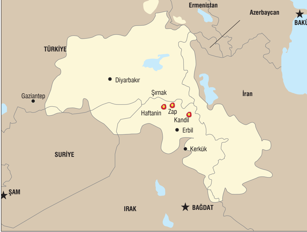
Harita 5: Kuzey Irak'taki PKK Kampları

2012: 188-9) PKK açısından iki cephede birden savaşmak anlamına geliyordu. Bunun yanı sıra Türkiye'nin diplomatik görüşmeler yoluyla KYB'yi ikna etme çabaları kısmi bir sonuç vermiş ve Kuzey Irak'ta kendi tabanının yavaş yavaş PKK'ya kaymaya başladığını fark eden KYB, PKK'ya mesafe koymaya başlamıştı (Özdağ, 2008: 218). Bu gelişmeler de PKK'yı KDP ile ateşkese götüren temel motivasyonlar olmuştur.