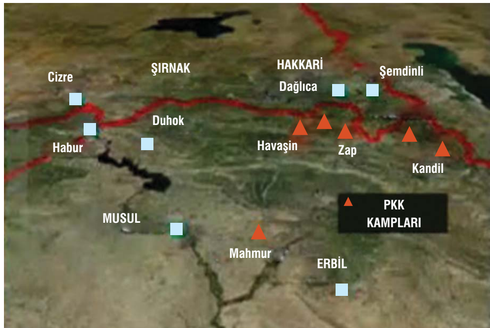
Harita 6: Belli Başlı PKK Kampları

Türk ordusunun Kuzey Irak'ta PKK kamplarına yönelik Mart ayında başlayan operasyonları Temmuz ayına kadar devam etmiş ve kapsamı da git gide genişlemiştir. Kay-