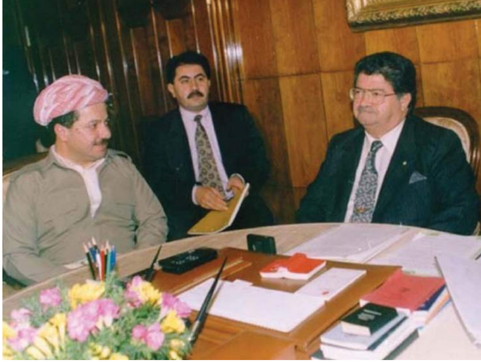
Resim 1: Barzani-Özal Görüşmesi

girildiği kapsamlı bir operasyon düzenlemiş ve bu operasyon sırasında PKK ve KDP'ye ait kamplar arasında net bir ayırım olmadığı için KDP'ye bağlı bazı kamplar zarar görmüştür (Oran, 2005: 133). Gerek Türkiye'nin merkezi Irak yönetimi ile antlaşması gerekse sınır ötesi operasyon sırasında KDP kamplarının zarar görmesi Irak Kürtleri, özellikle de merkezi Irak yönetimi ile çatışma halinde bulunan KDP temsilcileri arasında rahatsızlıklara neden olmuştur. Bu rahatsızlık KDP kadrolarını Türkiye'ye karşı bir ittifak arayışına yöneltmiş ve kısa bir süre sonra PKK ile 'Dayanışma İlkeleri Antlaşması' imzalanmıştır.