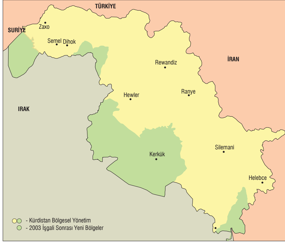
Harita 7: 2003 İşgalinin Ardından Kürdistan Bölgesel Yönetimi

Kürt Bölgesi'ne mi yoksa Irak'a mı dahil olacağı sorununa ise anayasanın 140. Maddesinde yer verilmiş ve en geç 2007 yılının sonuna kadar söz konusu yerlerde yapılacak referandumla buraların çözüme kavuşturulması hedeflenmiştir (Galbraith, 2007: 153-159).