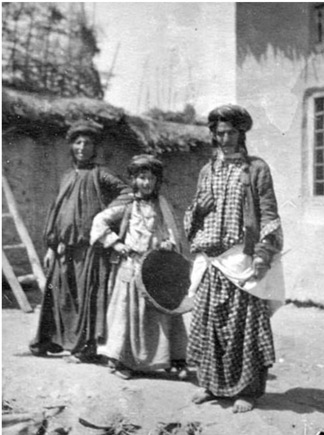
کورده‌کانی جووله‌که له په‌واندز سالی ۱۹۰۵