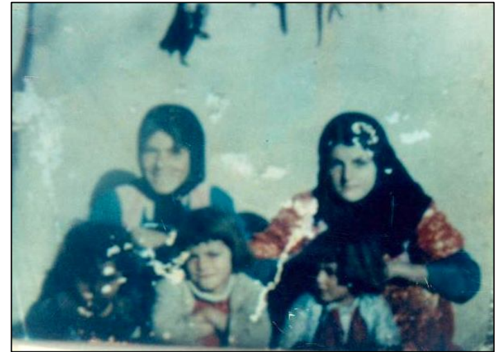
خیزانی دووه می مام فارس و منداله کانی