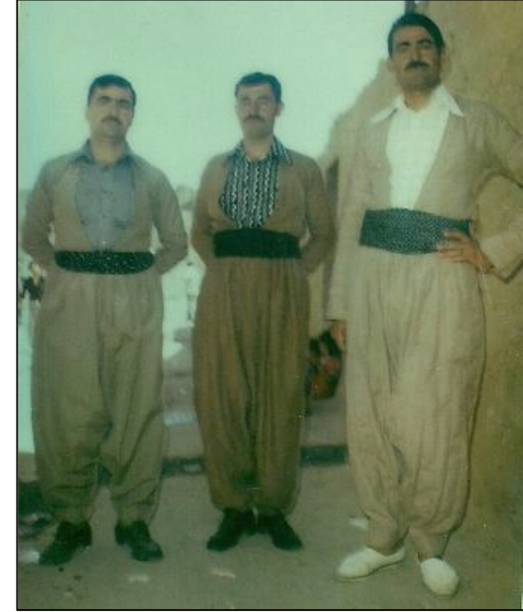
له راسته وه: