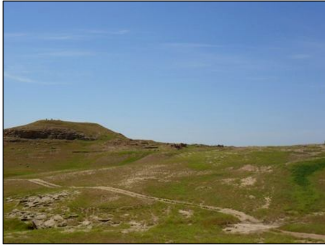
دی کی کهریم باسام له ئیستادا