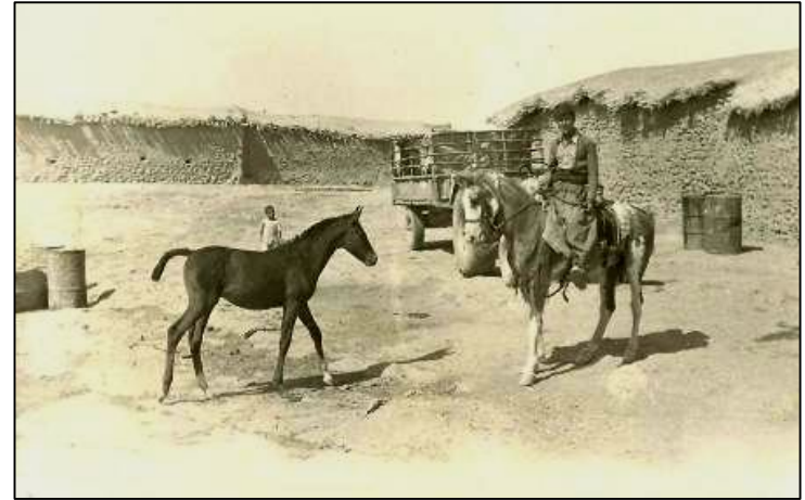
شہید جلیل عہدولآ / دی کہریم باسام