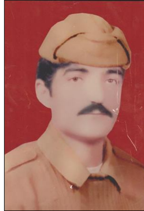
به شارات فهرج