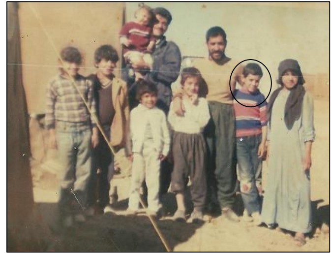
نووسەر و خیزانه که ی ۱۹۹۱ له ئیران