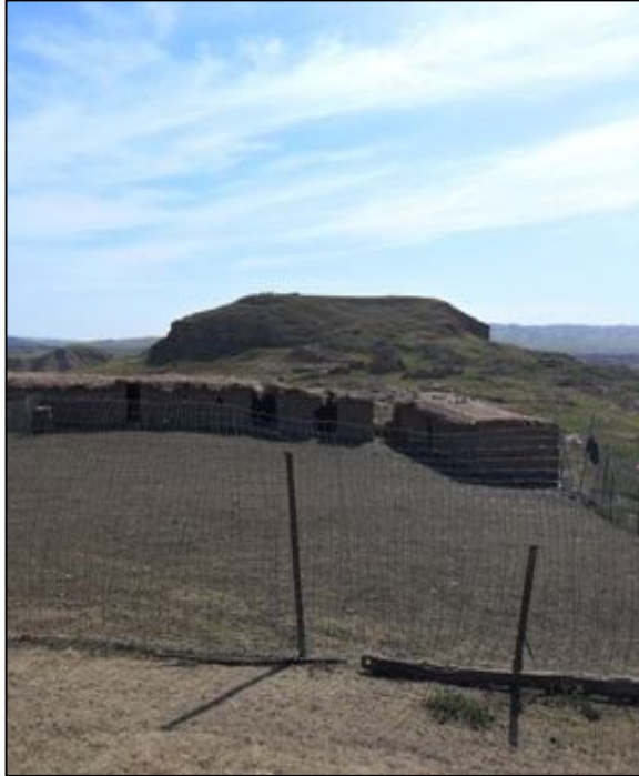
دی کهریم باسام