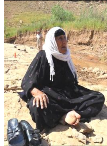
نه جمه عهزیز (چه م ته نگانه)