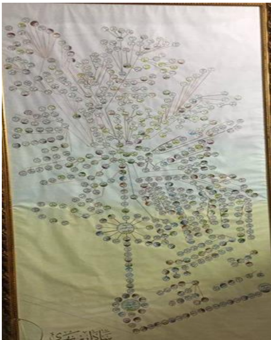
وینه‌ی دره‌ختی ساداتی نه‌ری.