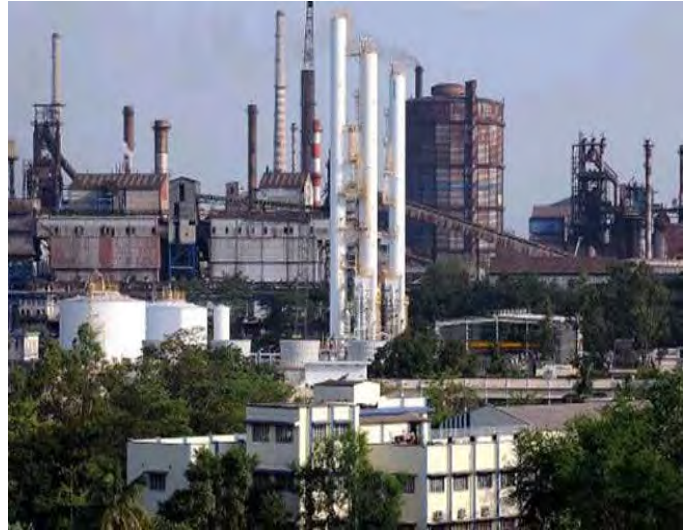
كاره گاني ستيل تا نا، جه مشيدپوور

له دواي مهرگي گاندي زور كه س هه وټيان دا ئه و ميټوده ي گاندي به كار به يين له به شه گاني ديكه ي جيهان. بو نمونه داكوټيكا ر له مافه گاني مه ده ني مارتين لوټهر كينگ له نه ته وه يه كگرتوووه گاني ئه مريكا. حومه ته نوټيه گاني سه رده م پيوستيان به هاوگاري و يه كگرتووي خه لگه كه ي هه يه، بوټه خوږاكري و خه با تي تاوندوتيزي (ساتياگراها) و خو پيشانداني ئاشتيانه ده بيته هو ي به ده ستهيئا ني هه ندي سه ركه وتن. به لام زور به ي گروپ و لايه نه گان كه ده يانه هو ي گوږانكاري گه وره له سيا سه ته دا بگمن هيشتا به ريگاي توندوتيزي شوږش ده كمن.