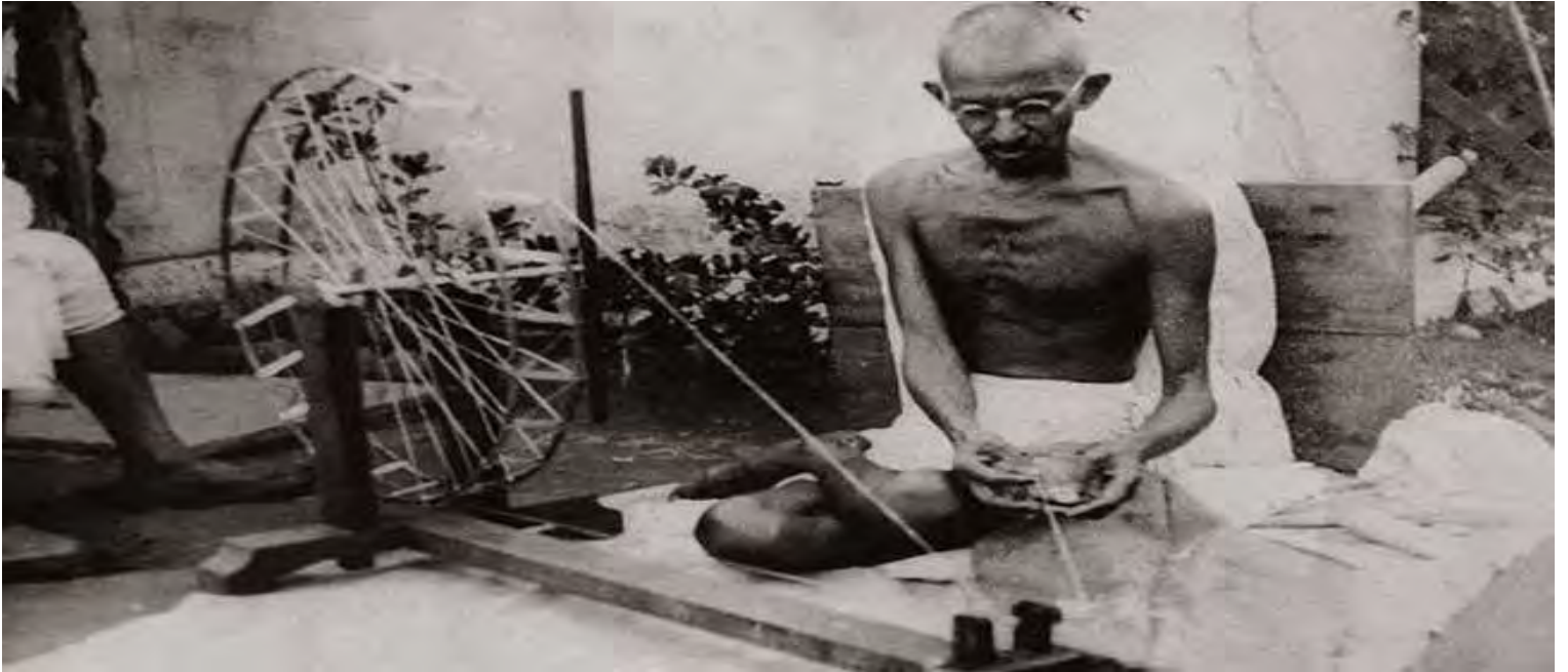
ئامبیری رستن (گاندى له کاتی خۆیشاندن)

کۆمهلايه تيش بگريته وه. ئامانجی ئه و لهم ريفورمه دا سيسته می قه بيلهی هيندوووه کان نه بوو، به لام ئه و خوئی له وه نه ده هات که جياوازی بگريت له نيوان قه بيله هيندوووه كاندا، که قه بيله ئاست به رزه کان زور جار بی بايه خانه ده يا نپروانيه قه بيله ئاست نزمه کان که ده يا نووت ئایي لهم جوړه که سانه نزيك بپنه وه. گاندى، بوخوی خه لکی (بانیا) بوو يان ئایفه ی (بزرگان و کاسبکاران) ئه و رپگر بوو له وه ی له ئاشرام ئهم جياوازییه په يره و بگريت. دوو باره ئهم نمونه يهش کاریگه ريه کی گه وره ی