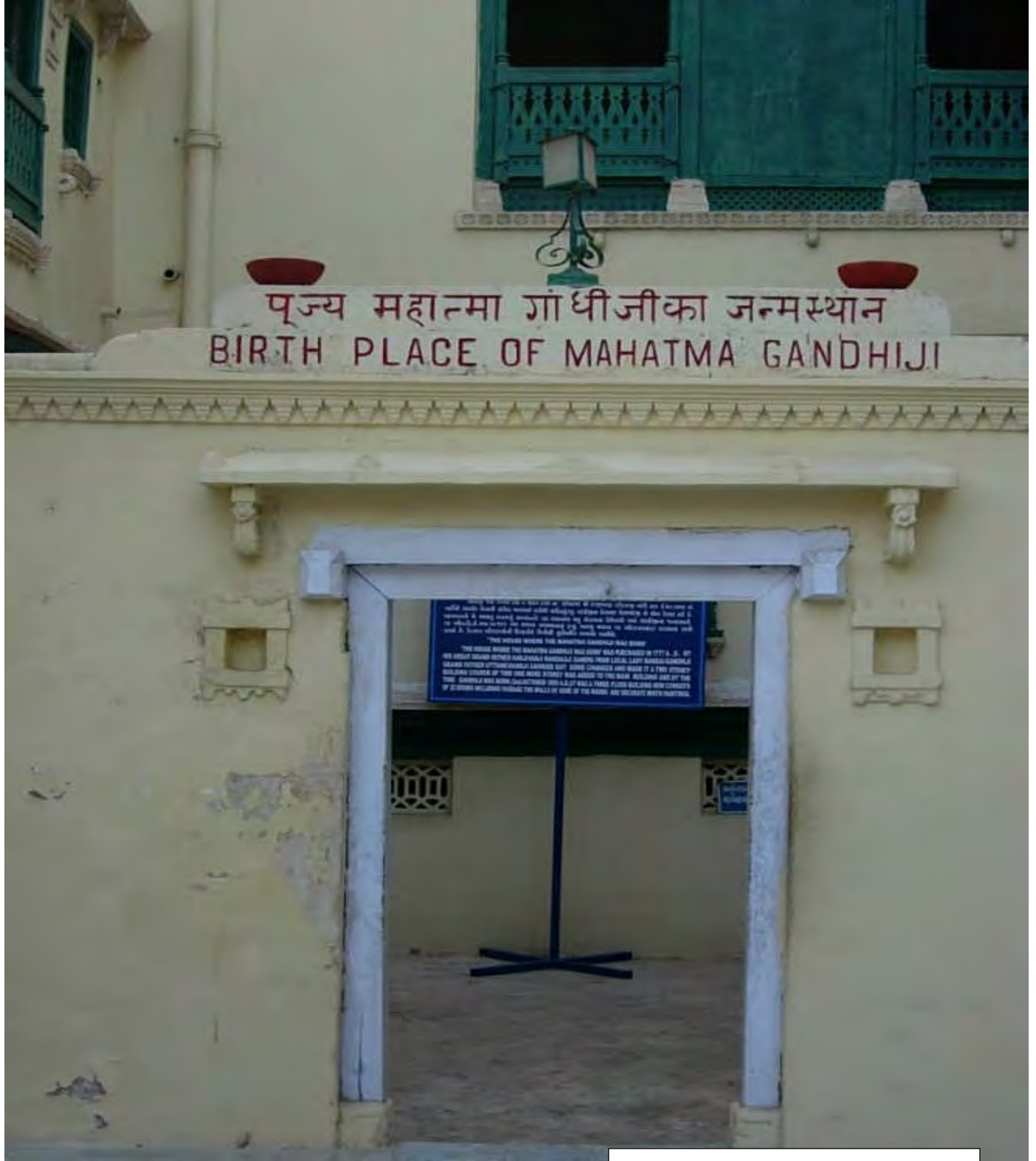
ئەو خانووی که گاندی تپیدا له دایک بوو