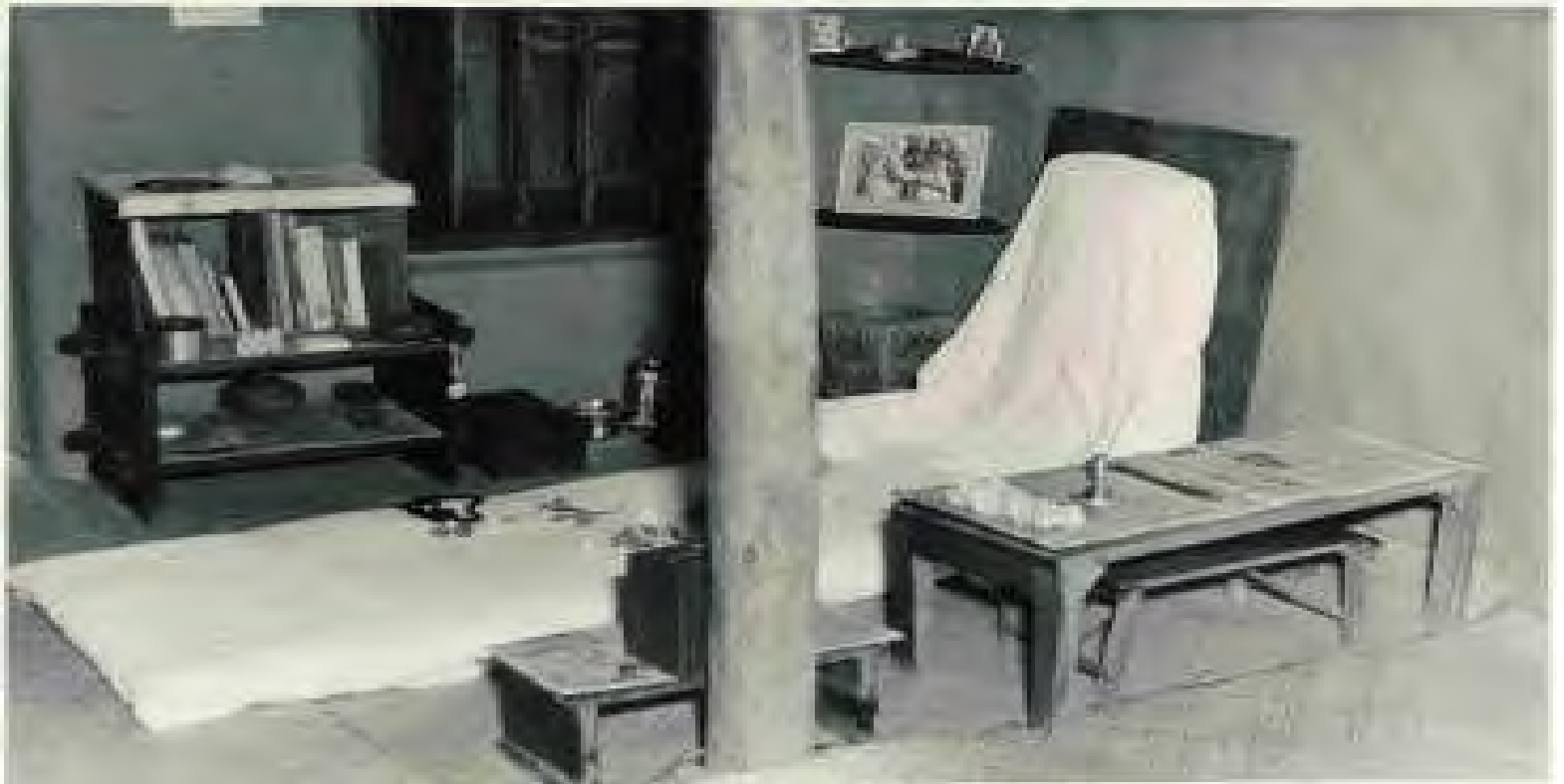
ژووری گاندی له ئه شرم له گوندی سیفاگرام

گاندی کهسیک بوو زۆر جار ئاسان نه بوو له گهلی بسازتی بویه زۆر جار خهلك گله بیان له وه هه بوو که گاندی زۆر بهی کاتهکان بۆ ههر شتیک به لگهی ئایینی دینیته وه که ئه وهش هاوکاری سیاسیانه بوو بۆ گاندی.