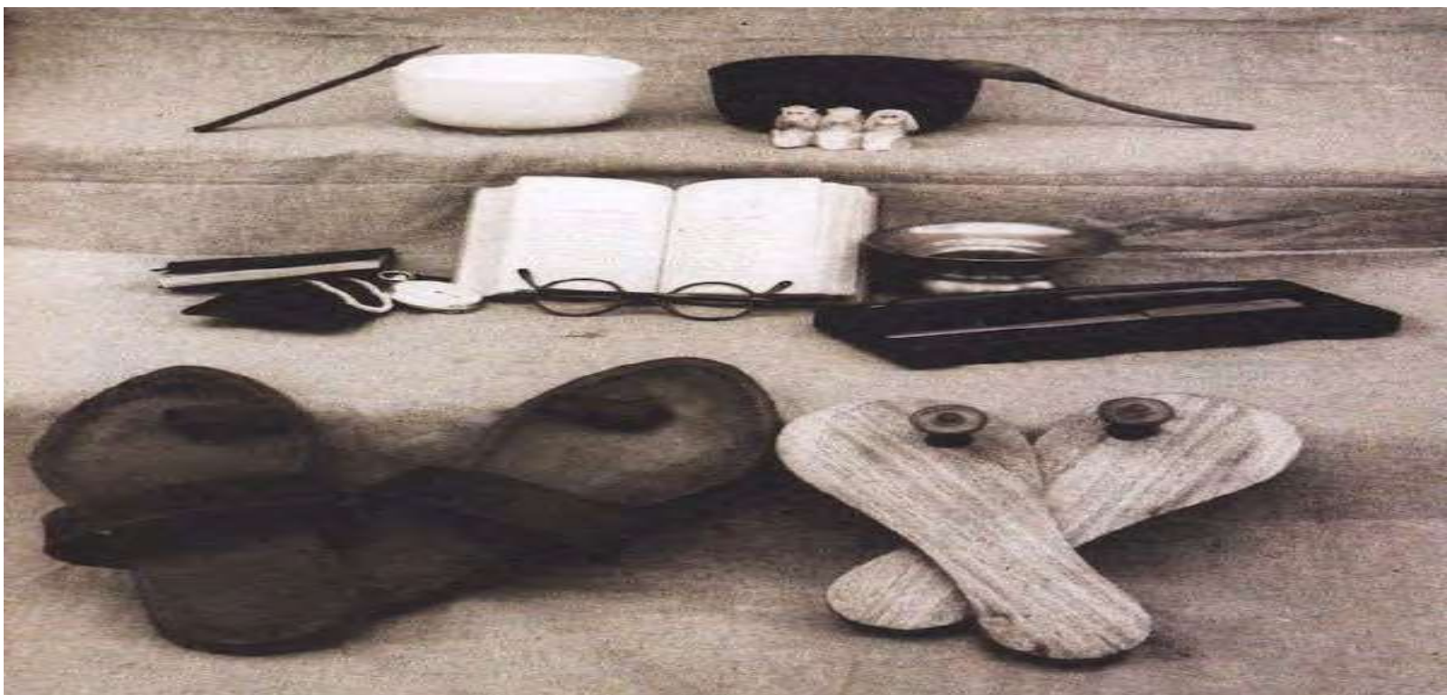
كەلپە لە گاندى

برېتېيە لە جەكى بېتوانايى مروفا، ئەوان ئەم رېگە بە بەكاردېن چوئكە ھېچ توانايى جەنگ يا خود چەكيان لە بەردەست نېيە. ساتياگراھا، بە ديويكى دېكە بە ماى ئەو ە دەھات كە چەكېكى بە ھېزى مروفا كە ھەئيدە بۇرېت چوئكە ئەم رېگە بەى بې باشترە لە جەنگ كردن. بەكارھېتايى ساتياگراھا، وات لېدەكات قەئەت بە دوژمنەكەت بەئىت كە ئەو ە تۆدە لېئى. نېشانى دەدەت كە تۆ ئامادەى زەجر و ئاخوشى بگېشېت بۆ ئەو ە خوراگرېت لە سەر باو ەرەكەت، كە ئەمە زۆر كرنكە بۆ خوش وېستنى دوژمنەكەت.