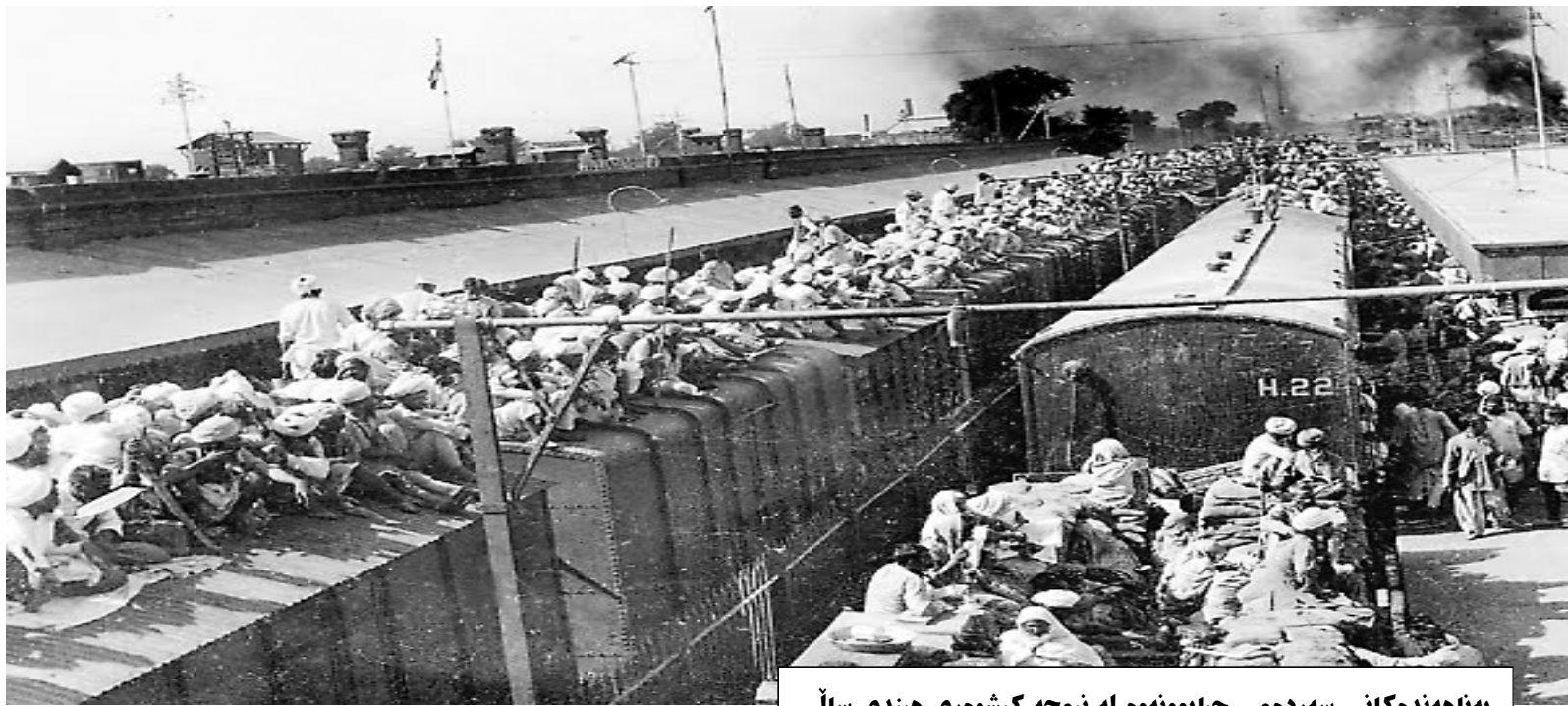
په ناهنده كانی سهرده می جیابوونهوه له نیمچه کیشوهری هیندی سالی

سالیدا ژيانی هاوسه رگیری پیکهیتا. له سالی ۱۸۸۸ بریاریدا بچیت بو نینکته را بو خویندنی یاسا. له ویدا گاندی بو ماوهی سی سال ژيانی ته نهی به سه ربرد، ژيانیکی خوشبه ختا نهی نه بوو له له نندن. به لام توانی خویندنه کهی ته واو بکات و وه کو پاریزه ریک بگه ریته وه هیندستان. به لام هستی کرد له ویشدا سه رکه نوو و نابیت و له گهل بارودوخه که نه ده گونجا بو کارکردن. دواتر له سالی ۱۸۹۳ به شیوه یه کی کاتی له باشوری نه فریتا کاری ده ستکوت، له ویدا ژماره یه ک هاوالاتی هیندی ده ژیان. گاندی له باشووری نه فریتا بوو که کاری سیاسی ده ستپیکرد.