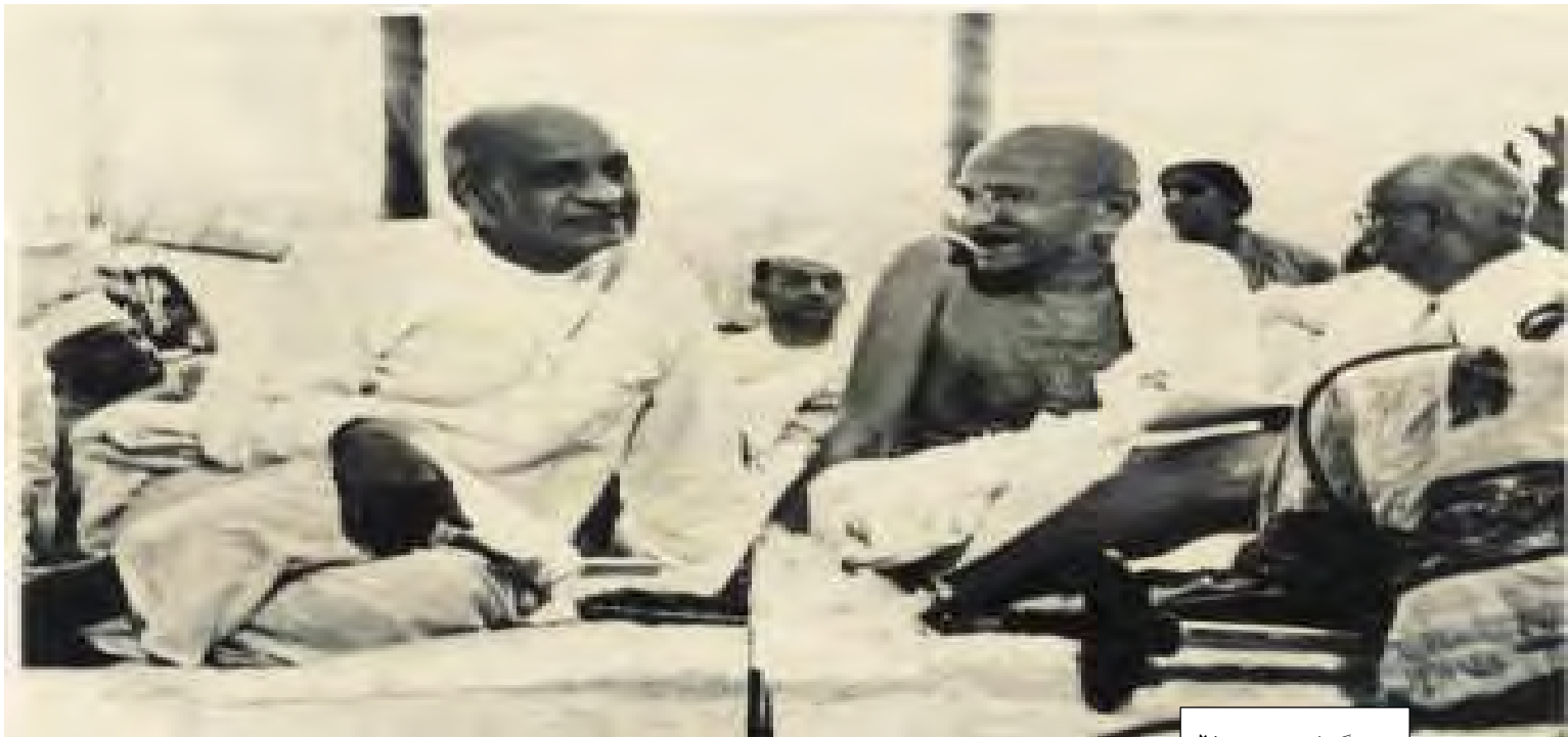
گاندى و پاتال

بكریت بۆ دوو ولات هیندستان و پاکستان. گاندى لای خوییه وه زۆر نارەحەت بوو لەم دا بەشکردنە بەلام نوێنەرانى كۆنى كۆنگرېس ئەمەيان بە تاكە رېگای چارەسەر لەقەلم دا. گاندى هېشتا گەورەترین و گرینگترین ناسیۆنالیست بوو بەلام ئەو چیتز رېبەر نەبوو. كاتیک هیندستان و پاکستان سەربە خۆیان بە دەستھێنا لە ۱۹۴۷/۸/۱۵ نەهرۆ و پاتال حكومهتی نوێی هیندستانیان گرتە دەست و جیئا حیش بوو بە سەرۆکی پاکستان. حكومهتی شازادە دا بەش كرابوو بۆ دوو حكومت هەریهكەو بە پێی ناوچەكانى خۆیان، لەگەڵ ئەو هەشدا هیندستان و پاکستان سەركەوتوو نەبوون لە سەر رېگەوتنەیان لە بارەى كشمیره وه و دەستیان كرد بە جەنگ لەسەر ئەم ناوچەیه. هەردوو ولات هیندستان و پاکستان دەستیان كرد بە بوئیدانانى ولاتە نوێیهكانیان. لە پاکستان كېشەى ئایبەتى هەبوو چونكە ئەو ولاتە لە دوو بەش پېكها تېوو كە هەزاران