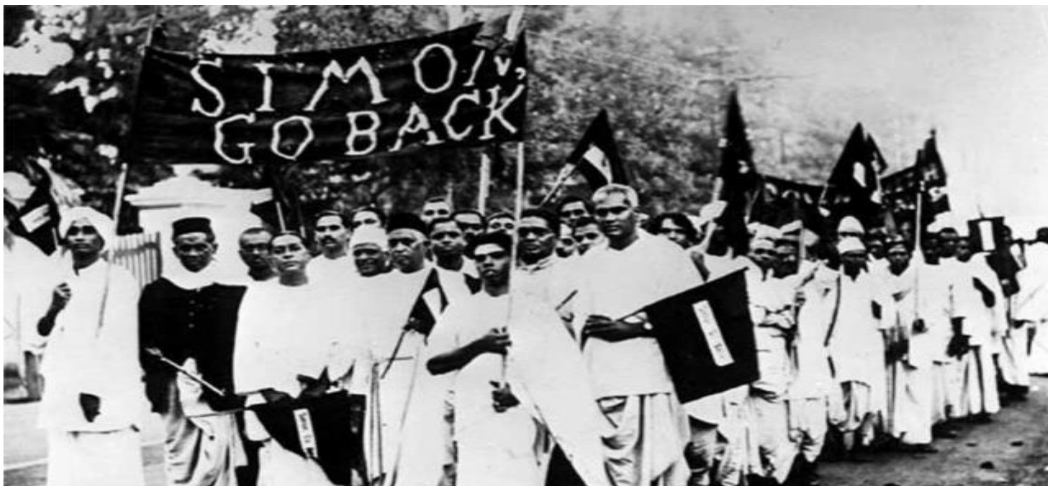
خۆپشاندانى ناسیونالیسته هیندییهکان دژ به کۆمسیۆنى سیمۆنى بهریتانى ۱۹۲۹

نوێنه‌رانی قه‌دیمی کۆنگرێس له دژی گاندی وه‌ستا نه‌وه. له ساڵی ۱۹۲۰ له لاکه‌پوور بیره‌که‌کانی له گه‌ڵ حیزی کۆنگرێس خسته‌ روو و په‌سه‌ندکرا. ئهم بیره‌کانه‌ بزوتنه‌وه‌ی دژه‌ هاوکاری له گه‌ڵ به‌ریتا نیه‌کان له خوگرتبوو ، که سیسته‌میکی نوێ بوو بۆ ریکخراویکی گریگ له کۆنگرێس ده‌یویست ریکخسته‌نیک بکات بۆ ئه‌و ناوچانه‌ی که به‌ هه‌مان زمان قسه‌ ده‌که‌ن و جله‌کانیان به‌ ده‌ستی خۆیان دروست ده‌که‌ن.