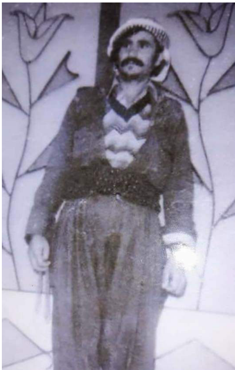
شهید نه‌حمده قه‌مبهری