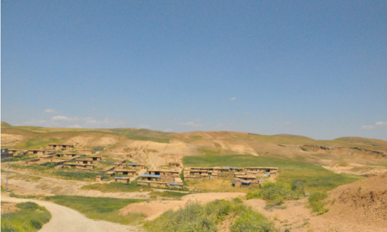
گوندى ئۆمەر گومت