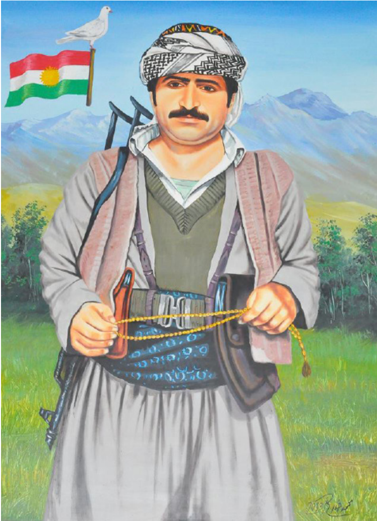
شهید نه حمەد قەمبەری