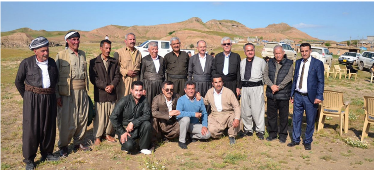
هاوسه نگرانی شهید نه حمده قه مبهری له سهر مه زاری شهید نه حمده، له گوندی قه مبهر