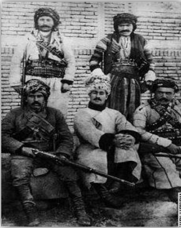
سمكويى ئاغايى شكاك دگهل كۆمهكا ههفچهپهريىن خۆ ل سالا 1887 - 1930 ز .