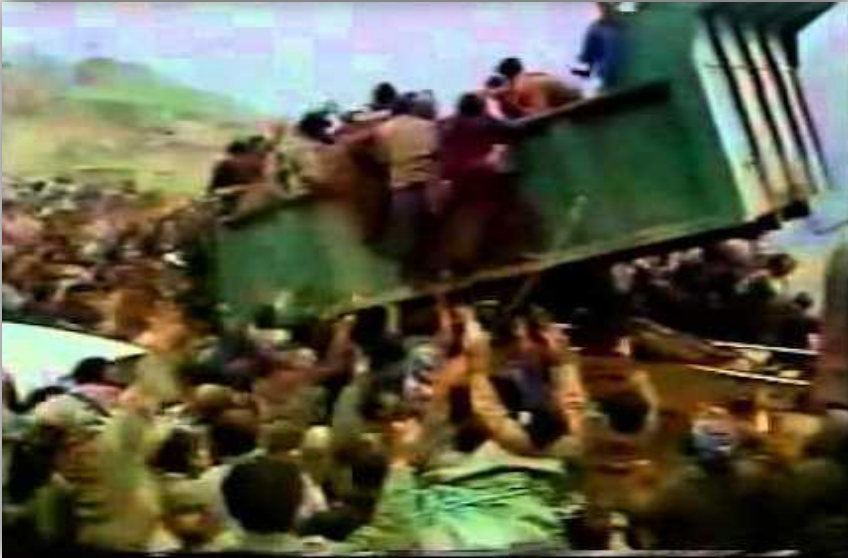
كۆچبەر بونا مليونا يا كوردان ل ئادارا سالا 1991ز .