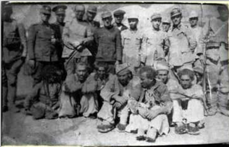
North Kurdistan – Dersim genocide or ethnocide of the Turkish army in 1938

گومەلگۆز بیهکەیی دەرسیم، دەرسیم باکوری کوردستان سالی ۱۹۳۷ بق ۱۹۳۸