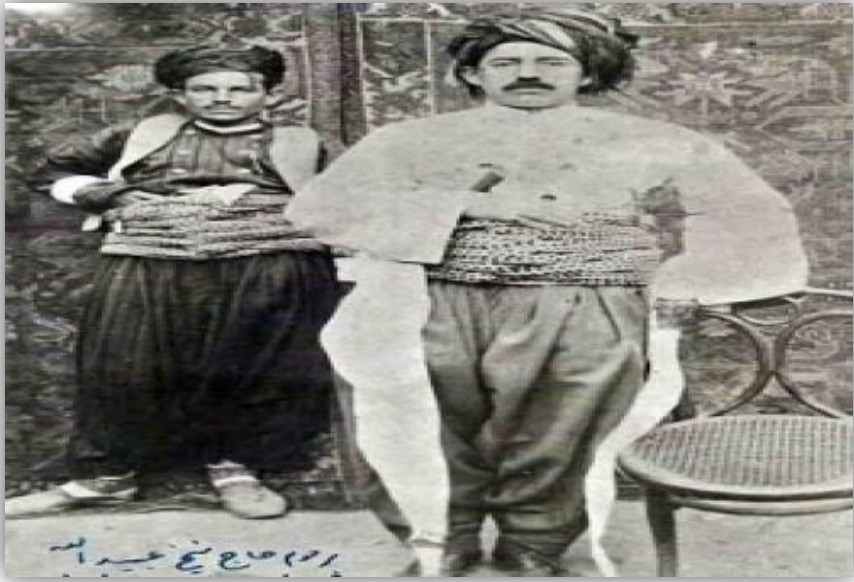
سەرکردی ئیکههه سهرهلدانا کوردی لژیئر نافی سهرهلدانا شیخ عهبدولایی نههری ل سالا 1880 – 1883 ز .