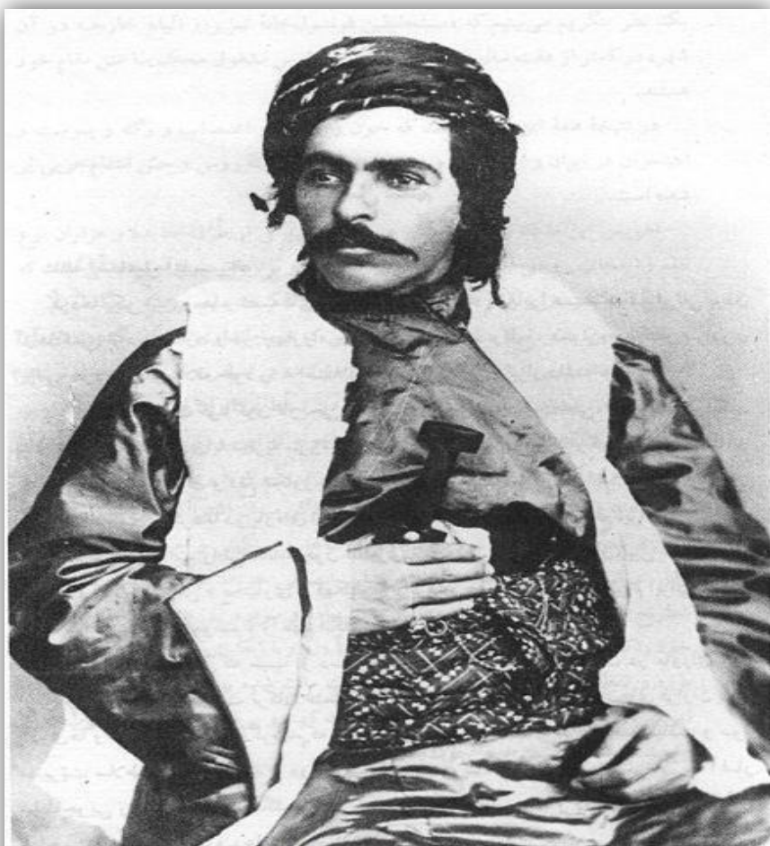
Simko Shikak 1887 – 31 Juni 1930

سەردارى كورد سىمكو شىكاك ۱۸۸۷ - ۲۱ حوزەيران سالى ۱۹۳۰