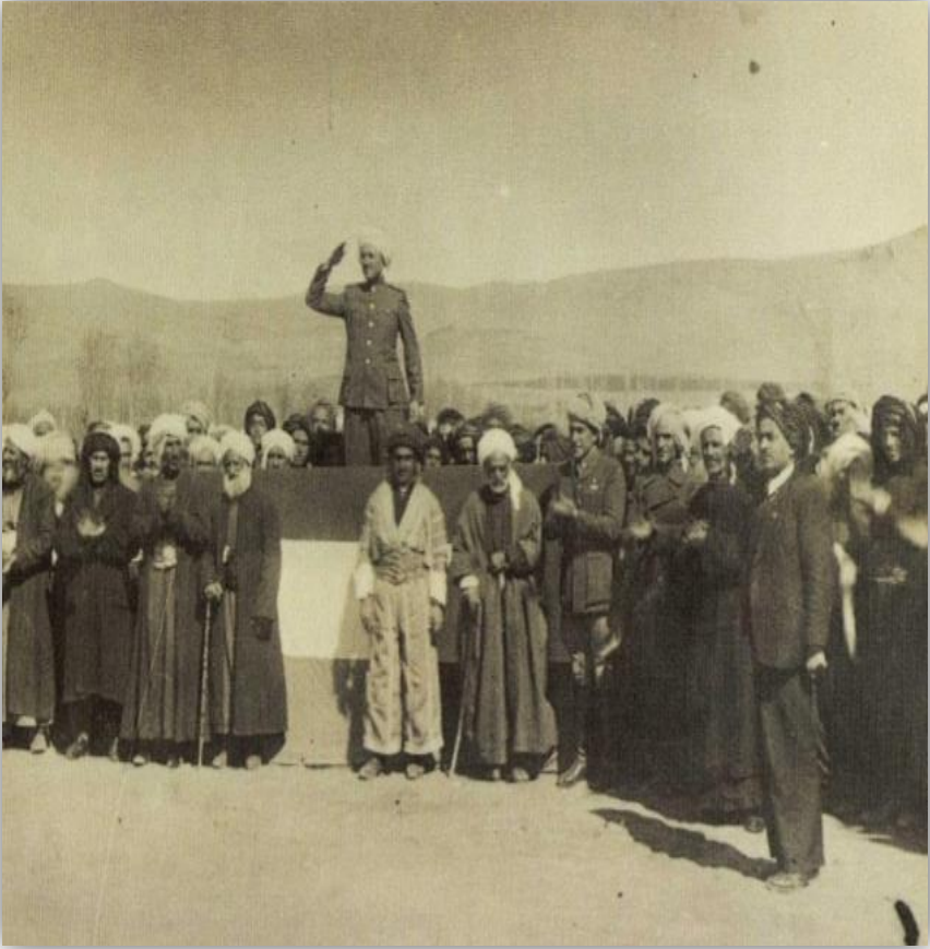
گۆرهپانا چوارچرا دهمنّ راگه‌هاندنا کۆمارا کوردستان یا پایتەختنّ وی مه‌هاباد، ژلاینّ پيشه‌وا قازی محه‌مه‌د ل سالا 1946ز.