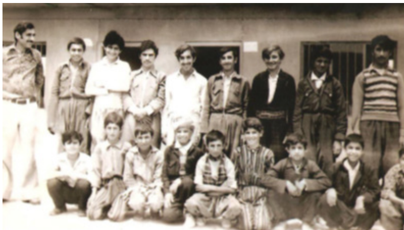
کۆمەلەیک خۆئندکاری بارزانی که له پڕۆسە ی کۆمەلکۆژییە که گیران و کۆمەلکۆژکراون .