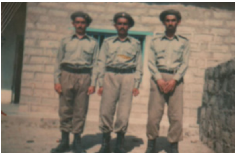
سێ پیاوی بارزانی که له کاتی کدا سه ریا ز بوون گیران و کۆمەلکۆژ کراون .