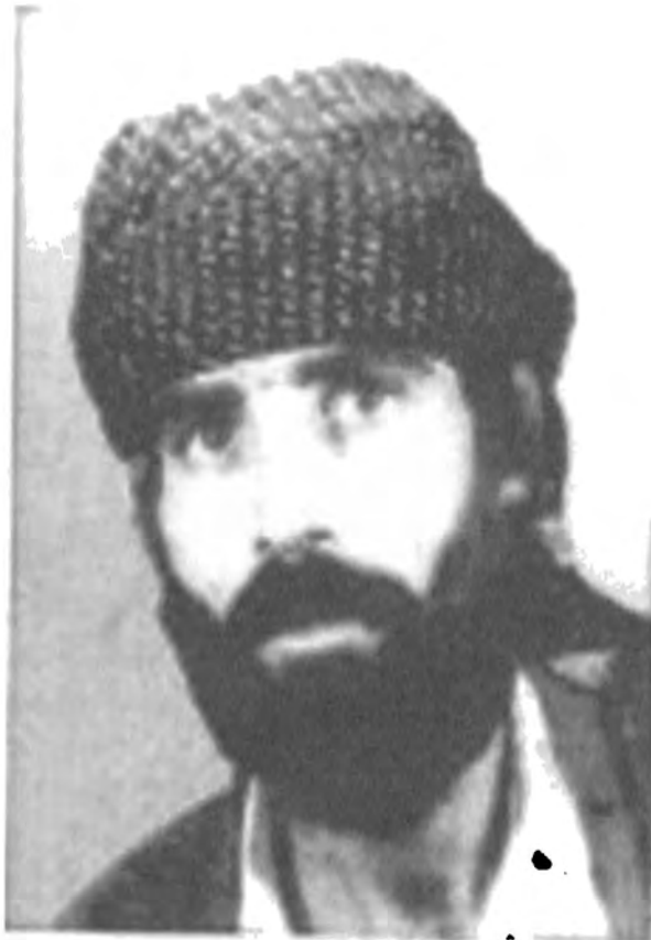
محمد مدد سعید نه‌مین ناسراوه به حه‌مه باوای