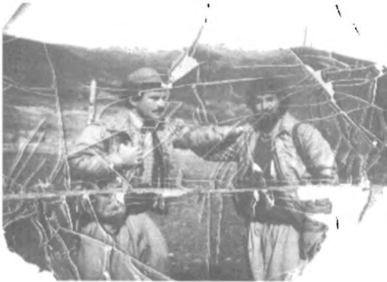
ماموستا نه‌گه‌ن همه‌ چاو جوان کفری دیی گا بیلون ناوچه‌ی جافایه‌تی