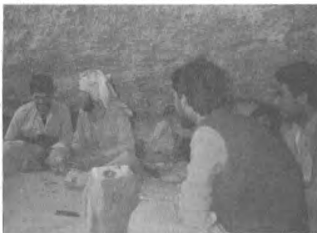
ئەكە ئومىزى خۇرنەھەزان / مانگى ۱۹۹۰/۸

لاى راست سەرموھ: ھەسەن - نورى مەسۇبى - نامىق زەنگابادى - نە جىب زەرداۋى - برايم چاوجوان - مە ھامود چالە رەش - شەھىد مە ھامود زەنگابادى - مەلى گە لائى لاى راست خوارمۇھ: برايم يارمەرىيى - مە لا عىرقان - بەكر چاوشىن - شەھىد مە ھامود