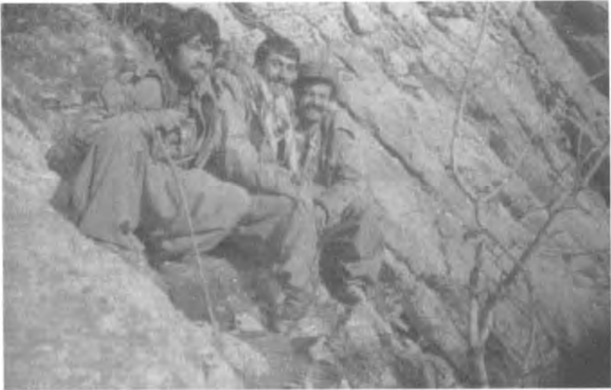
بناري شاخي تپه گه روس / مانگي ۱۹۹۰/۴ رمثلي پارتيزانه كاني گه رميان لاي راست، شهيد حه مه ناغا - نه وشيروان شيخ له نگه ري - حه سه ن نومد رملي