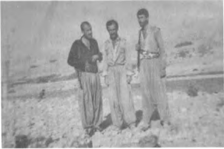
لهسه ر ناومسپي له به رامبه ر خور نه و مزان - سالي ۱۹۹۰ لاي راست، نه وشيروان نه حمده - كاك مه لا سه عييد - كاك كو كزي