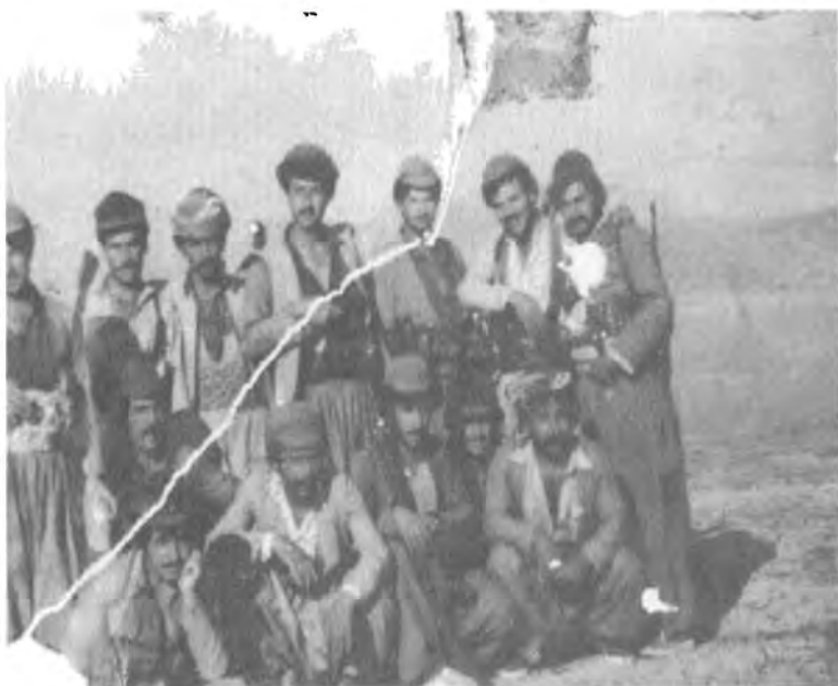
دینی سوهی ره حیم ژماره یه ک له پارتیزانه کانی گهر میان