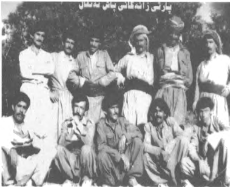
ژماره‌یه‌ک پارتیزانی گهرمیان - بله‌کنی سه‌ر به‌شاری بانه مانگی ناب ۱۹۸۹