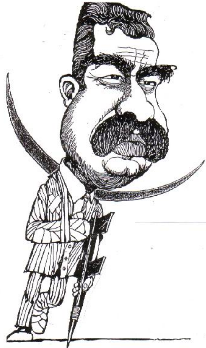
ئهو وینه كاليكاتورييهى سه‌دام له كتنيكي سويدي وه‌رگيراوه، به‌داخه‌وه ناوهى كتنيكه‌م له ياد نيبه.