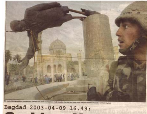
۲۰۰۳/۴/۱۰ رۆژنامه‌ی Metro

رۆژی ۲۰۰۳/۴/۹ په‌یکه‌ره شه‌ش میتریه‌که‌ی سه‌دام له به‌غدا هینزایه خواره‌وه. به‌پیی ئه‌و وینانه‌ی که له رۆژنامه‌کاندا چاپکرا، هه‌روه‌ها ئه‌و گوزارشانه‌ی که له ته‌له‌فیزیۆنه‌کان له کاتی هینانه خواره‌وه‌ی په‌یکه‌ری سه‌دامدا بلاو کرانه‌وه، نزیکه‌ی دووسه‌ده‌سه‌سێک له خه‌لک به‌رچاو ده‌که‌وت. هه‌بوونی خه‌لکی که له رۆژهدا خۆی نیشانه‌ی نارهبازی