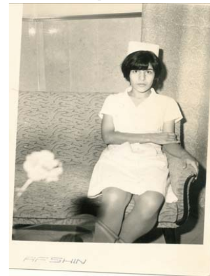
ئەو وینتە لە نووسراوہی (بە مناسبت سێهەمین سال جاویدانە شەهین باوفا- نووسەر نیما- سنندج) وەرگیراوہ

www.alefibe.com/article_Boroumand_Ladan.htm