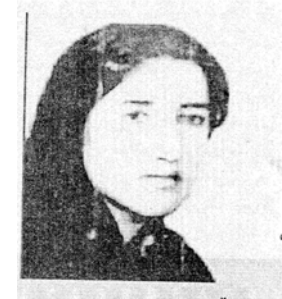
فه زیله ت دارابی