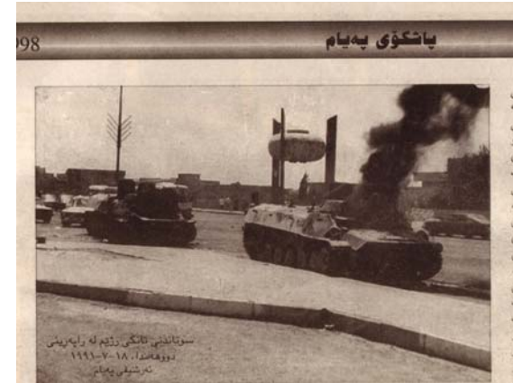
مانگنامه په‌یام - چاپی له‌نده‌ن

ناوچه‌که‌یان به جوړیک میلیتاریزه کرابوو که له هه‌ر چواراپه‌کدا چوار تفه‌نگی چوارلولول، له هه‌ر کۆلانی‌کدا چه‌ند چه‌کداری عه‌سکه‌ر، له‌سه‌ر هه‌ر