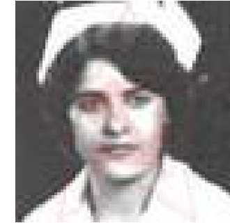
نه سرین که عبی