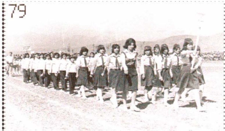
به‌ره و ئاسۆ

دوژمن ییت ئۆشیم جامی پر له ژار چوار ده‌ورت گرتووم به دووکه‌لی ژار چی ژارت هه‌یه بیکه‌ی به سه‌رما نه چۆک دائه‌دهم نه ری ئه‌که‌م خۆار!