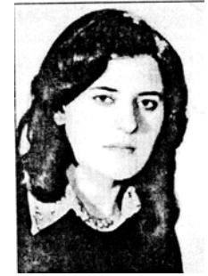
شه هلا (زه هرا) که عبی