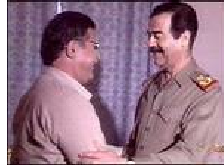
جه‌لال تاله‌بانی و سه‌دام

ئیراق ئه‌نجامدا، ئه‌و کاره‌ی ئه‌وان له باری سیاسیه‌وه کاردانه‌وه‌یه‌کی گه‌لی زینابه‌خشی هه‌بوو له سه‌ر هه‌ستی خه‌لکی جهان سه‌باره‌ت به‌ شۆرشی کوردستان.