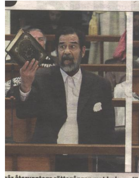
وینته له رۆژنامهی City

رۆژی ۲۰۰۳/۱۲/۱۳ (سه دام) دهسگیرکرا. پاش ههوت مانگ له رۆژی ۲۰۰۴/۷/۸ له بهغدا برایه دادگا و له لایهن قازییهکی ئیراقیه وه که وهته بهر لیپرسینه وه، با سه بارهت بهو دادگایه لهو چهن دیره بروانین: