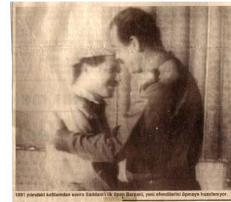
مه‌سعود بارزانی و سه‌دام رۆژنامه‌ی Ozgure politika

هه‌لۆیستی کورد و کۆره‌وه‌که خه‌لکی ئه‌و شار و گوندانه‌ی کوردستان که بوون به‌ په‌ناگای کۆره‌وه‌که به‌ دوو شیوه‌هه‌لۆیستیان ده‌ربری.