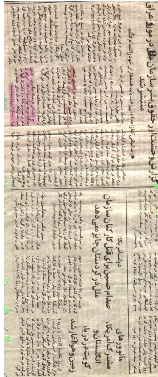
که‌یهان له‌نهدن ژ- ۵۰۱ پیچشه‌مه ۱۹۹۴/۴/۱۴

له‌ژێر سایه‌ی ئهو فه‌رمانه‌ی سه‌دام به‌پیتی هه‌وائی ماسمیدیای جهانی له سالی ۱۵۲۰۰۰ سه‌دان ژن له‌ به‌غدا به تاوانی ئه‌وه‌ی خۆفروشن کوژران و سه‌ریان له‌ جه‌سته‌یان جیا کرانه‌وه و به‌سه‌ر ده‌روازه‌ی ماله‌کانیان‌ه‌وه هه‌تواسران تا ژنانی دیکه‌ بیه‌ر له چاره‌نووسی خۆیان بکه‌نه‌وه. بۆ ئهو تاوانه‌ له‌و دادگاییانه‌دا نه‌هاته ئاراوه‌؛ بۆ ئهو تاوانه‌ له‌ تاوانی دوچه‌یل که‌مه‌هاتر و بێبایه‌ختر بوو؟ خۆ ئهو ژنانه‌ ته‌قه‌یان له‌ سه‌دام نه‌کرد بوو، ئهو که‌سانه‌ که‌ که‌وتیوه‌نه ئهو بارودۆخه‌وه ئه‌وه ده‌سه‌کوتی سیاسه‌تی په‌روه‌رده‌یی ده‌وله‌تی ئێراق بووه!