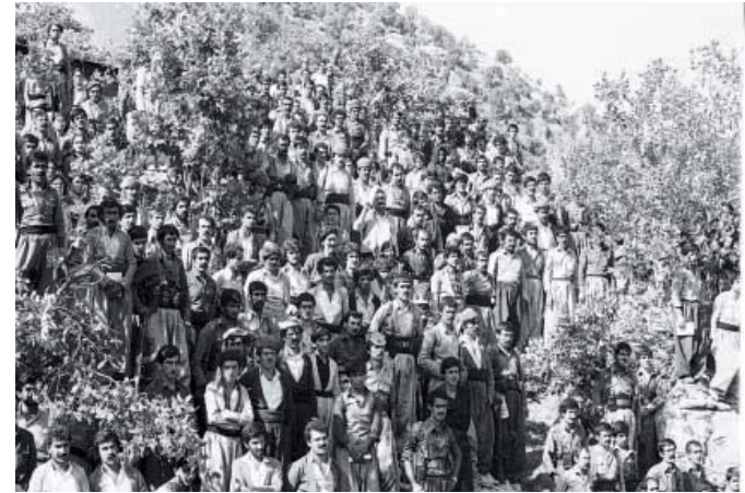
له پیناو ۲۷ سه له بی حیزبی کۆمونیستی ئیران دا

ئه وه هه لوئیسیتی حیزبی کۆمونیستی ئیران بوو سه بارهت به بوومبارانی شیمیایی هه له بجه و ناوچه کانی دیکه ی کوردستان به ده ست ده وله تی ئیراق.