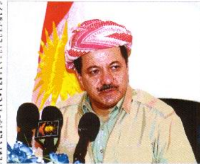
من هیج پۆستیگ به دامه‌زراندن وهرناگرم