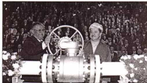
ههات. به سهده بێگانه ههنازدهی نهوتی کوردستان و ههنازدهی نهوتی کوردستان...