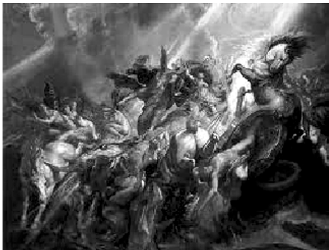
که‌وتنی فایه‌تۆن. وه‌کو چۆن "روبینس 1577-1640 Rubens" "رەسمی کردووه"

فایه‌تۆن، که گالیسکه‌ی باوکی و ئەو چوار ئەسپه‌ جوانه نەمره به‌هیزانه‌ی رايدەکیشن، دەبینیت، لپی دەخوازیت که بهیلێت ئەو رۆژه، خۆی گالیسکه‌که لیبخوریت. فیۆبەس نه‌یده‌زانی که کورپکه‌ی شتیکی ئەوه‌نده گرنگ و گرانی لێ دەخوازیت؛ چونکه لیبخورینی ئەو گالیسکه‌یه، یه‌کیکی زۆر پسپۆری گەرکه؛ لیبخورینه‌که‌ی کاریکی ئاسان نییه. زۆر هەولده‌دات له‌گه‌ڵ