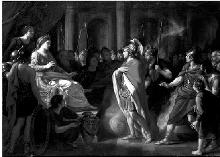
دیدۆ و ئینیەس کە یەكەمین جار یەكتری دەبینن

ئەو کاتە ئینیەس بەرێگاوه دەبیت بەرەو ئیتالیا، بۆ دامەزراندنی دەولەتی رۆمانی، "ئەفرۆدیت"ی دایکی (۲) ، بانووخواوەندی جوانی و خۆشەویستی، دەبیت بەرەبەری و دەبیات بەرەو