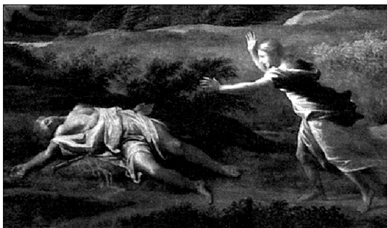
زیسبی که ده گه ریته وه، و پیرانهس ده بینیت خۆی کوشتوو وهکو چۆن "نیکۆلهس پوسین 1595-1665" Nicholas Poussin "ره سمی کردوون"

له دوا ی چه ند روژیک خه لکی شاره که ده بین تووه سپییه کانی داره که، نه خته به نه خته رهنگیان سوور هه لده گه ریت و تامیان مزر و خۆش و شیرینتر ده بیت. ئیتر له ناو خه لکه که دا وا بلاو ده بیتته وه که دارتووه پیره که، ناگادار بووه چی له ژیر لق و گه لاکانیدا ئه و روژه رووی داوه. ئینجا بۆ ئه وه ی یادی ئه و ئه قینه پیرۆزه ی ئه و دوو دلداره، به هه میشه یی بپاریزیت، به خوینی ئه وان به ره کانی خۆی رازاندووه ته وه و تامیانی خۆش کردوه. ناوی تووه که ده نین "شاتوو" و تووه کانی له ناوچه که دا بلاو ده که نه وه.