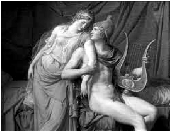
پاریس و هیلین وهکو چۆن روبینس 1577-164 Rubens رهمی کردوون

لهو چهند رۆژدا ئەفرۆدیت، ئەفینیکتی وا زال دهخاته دلای هەردووکیانهوه؛ شهیدایان دهکات بۆ یهکتی. چهند شهویک پیکهوه رادهبوین. له دوایدا برپار ددهن که پیکهوه رابکن و بچن بۆ تهرواده. هەر که دهگهته تهرواده زهماوهندیکی گهوره دادهمهزین و یهکتی دههین.