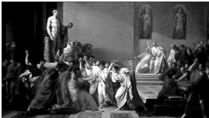
کوشتنی یولیهس قه یسه ر وهکو چۆن

له شوباتی ۱۸۴۴ی پ. ز، په رله مان بریار ده دات که قه یسه ر هه تا ماوه هیزی دیکتاتوری بدریتی. ۱۸ی مارت، قه یسه ر به ته ما ده بیت بچیت بۆ جهنگ دژی فارس. له بهر ئه وه بریار ده دات ۱۵ی مارت په رله مان کۆ بیته وه بۆ مائناوایی لیکردنی. هاوسوینده کان، بریار ده دن که له و روژدا، له کاتی کۆبوونه وه کهدا، بیکوژن. چونکه بۆ ناو خانووی په رله مان ئه وهی ئه ندام نه بوایه ریگی نه ده درایه بچیته زووره وه، له بهر ئه وه قه یسه ر پاسه وانی له گه لدا نابیت. ریکیش ده کهون که هه ر که سیکی خه نجه ره کهی له ژیر جله کانی خویدا به شاریته وه و هه موویان به شداری بکهن له کوشتنه کهیدا. وهکو باس کرا، ده مگۆ ده رباره ی ئه م کوشتنه له رۆمادا بلاو بوو بووه وه، به لام کهس نه یده زانی