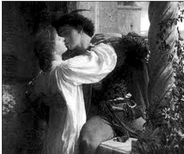
رۆمیۆ داده‌به‌زیت و ده‌روات. وه‌کو چۆن "فرانک دیکسی

هه‌ر ئاوا ده‌رۆیت، قیانم، به‌گم، مێردم، په‌روه‌رم؟ من، هه‌موو رۆژیک، به‌سه‌عات ده‌بیت، هه‌وال و ده‌نگ و باست ببیستم. چونکه‌ له‌مه‌ولا، ئەمن ده‌زانم،