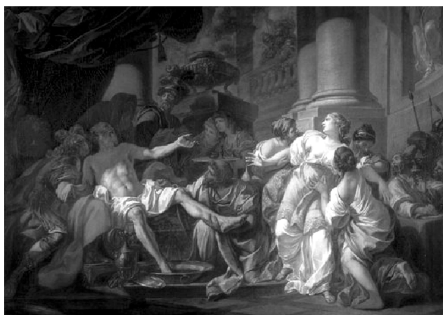
خۆکوشتنی سینیکا، وه‌کو چۆن

دهسووتا و ویران دهبوو، نیرۆن، بهسهرخۆشی، ئەو شیعراڤه‌ی دهخویندهوه که "هۆمیرۆس" و "فیرجل Virgil"، کاتی خۆی دهرباره‌ی سووتاندنی شاری ته‌رواده، نووسیویوان. (۱) شاره‌که که بینا ده‌کریته‌وه، زۆربه‌ی خانووه‌کانی به به‌رد و مه‌رپه‌ی دروست ده‌کریڤن. هه‌ر له‌ویشدا، نیرۆن، کۆشکیکی نایابی زۆر جوان و مه‌زن به باخیکی گه‌وره‌وه بۆ خۆی دروست ده‌کات. ناوی ده‌نیت کۆشکی "زیرین".