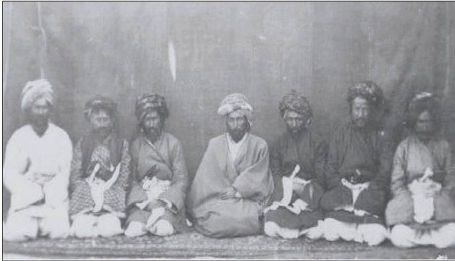
محهمه دئاغای مامه ش حاکمی لاجان و کهسانی