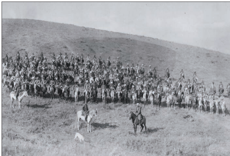
قهره‌نی ئاڭای مامه‌ش و سواره‌کانی سالی ۱۳۰۸ ی هه‌تاوی