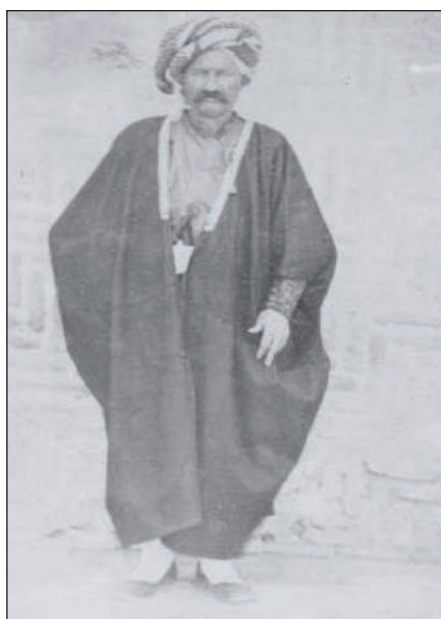
کاکه‌للاغا برای هم‌مزاغا