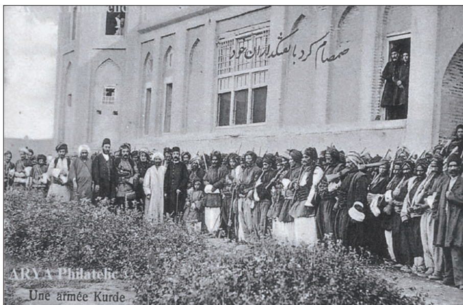
سامسام و چه‌کداره‌کانی (ویدیه‌چی له چه‌په‌وه چواره‌م که‌س سامسام بی، ئه‌وه‌ی به لای کلاو به‌سه‌ره‌که‌وه ویستاوه)