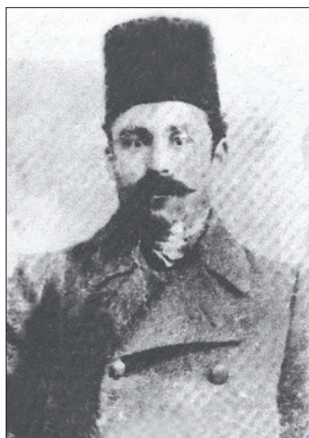
گویه‌نمه وینه‌ی هم‌مزاغایه