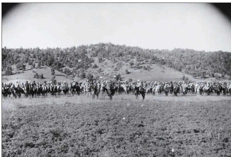
عه‌لی ئاڭا و سواره‌ی دییۆکری، سالی ۱۳۰۸ ی هه‌تاوی