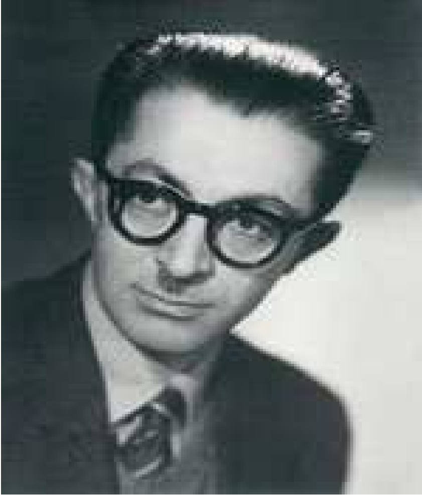
سادقی ہدایہت 1951-1902